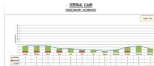
Gambar 2. Customer Claim

Adapun fenomena kualitas produk OQC terhadap claim customer , dapat dilihat pada Gambar berikut: