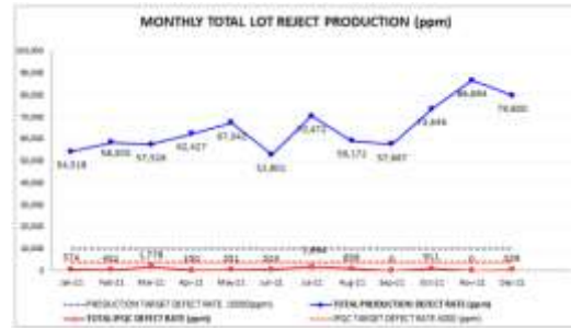
Gambar 1. Hasil Laporan Lot Reject Production Periode Januari – Desember 2021

Berdasarkan tabel 1 di atas masih sering terjadi pelanggaran SOP di Departement Quality Control . Dimana pelanggaran tersebut dapat mengakibatkan hasil kualitas yang tidak baik. Adapun fenomena pengendalian kualitas QC ( Quality Control ) terhadap lot reject production dapat dilihat pada Gambar berikut: