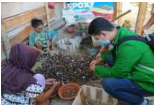
Gambar 2. Pengumpulan Bahan Kerajinan di Pesisir Pantai

Kedua, Community Map. Kegiatan pada tahap ini yakni dengan meningkatkan pengetahuan komunitas dampingan mengenai aset dan atau sumber daya alam yang melimpah di sekitar pesisir pantai dengan mengajak komunitas dampingan menyisir pesisir pantai guna mengumpulkan bahan kerang untuk pelatihan (Gambar 2).