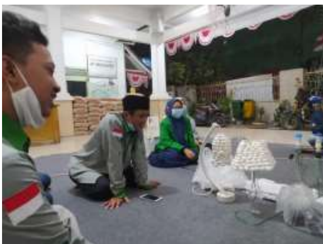
Gambar 3. Diskusi Potensi Ekonomi Kerajinan kerang yang didapat

Kedua, Leaky Buckle . Pada tahapan ini melalui diskusi dengan semua subjek dampingan dan pejabat Desa Banjar Kemuning mengenai perhitungan harga modal dan harga jual kerajinan yang dihasilkan.