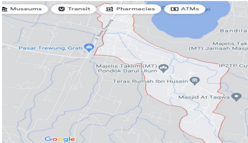
Gambar 1. Peta Wilayah Desa Kalipang

sedang yaitu 156 m di atas permukaan laut. Desa Kalipang terletak di wilayah Kecamatan Grati Kabupaten Pasuruan dengan posisi dibatasi oleh wilayah desa-desa tetangga. (Wikipedia, 2020)