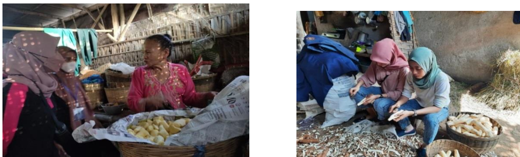
Gambar 3. UMKM Industri Tape Singkong

Kelemahan dari Desa Kalipang adalah terletak pada sumber daya manusia dan cara pemasaran produknya yang masih belum bisa menjangkau banyak konsumen, hanya masyarakat sekitar Desa Kalipang saja yang mengetahui produk-produk industri yang dihasilkan oleh masyarakat Desa Kalipang. Dari sisi pengemasan, produk yang dihasilkan masih dikemas seadanya dengan kantong kresek dan belum di beri label merk, dan produk yang dihasilkan masih monoton yaitu singkong yang diolah dalam bentuk tape dan kerupuk samiler.