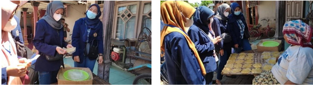
Gambar 2. UMKM Industri Kerupuk Samiler

Kelemahan dari Desa Kalipang adalah terletak pada sumber daya manusia dan cara pemasaran produknya yang masih belum bisa menjangkau banyak konsumen, hanya masyarakat sekitar Desa Kalipang saja yang mengetahui produk-produk industri yang dihasilkan oleh masyarakat Desa Kalipang. Dari sisi pengemasan, produk yang dihasilkan masih dikemas seadanya dengan kantong kresek dan belum di beri label merk, dan produk yang dihasilkan masih monoton yaitu singkong yang diolah dalam bentuk tape dan kerupuk samiler.