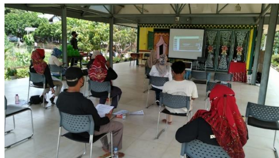
Gambar 3. Kondisi Pelatihan On-Site

Panitia menjelaskan bahwa salah satu cara yang dapat dilakukan adalah dengan sadar diri untuk ikut serta dalam pengembangan diri. Bentuk dari pengembangan diri tersebut dapat dilakukan melalui pelatihan pengembangan karakter. Mengingat pentingnya pengembangan karakter perlu disosialisasikan kepada warga RPTRA Pola Idaman sehingga pengetahuan tentang pengembangan karakter di era disrupsi bertambah.