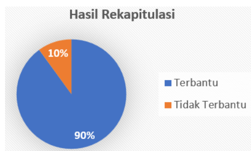
Gambar 5. Diagram Hasil Rekapitulasi

Tim dosen atau tim tutor mencoba menganalisis lebih dalam lagi dari masukan diatas menggunakan pertanyaan-pertanyaan yang mengerucutkan kepada indikator apakah kegiatan pelatihan pengembangan karakter di era disrupsi ini cukup membantu atau tidak dapat dilihat melalui gambar berikut ini: