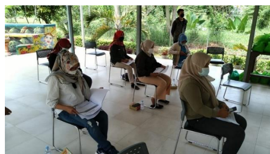
Gambar 4. Case Study Pelatihan On-Site

Kegiatan pengabdian masyarakat ini dihadiri oleh warga yang berada di lingkungan RPTRA Pola Idaman. Warga menyimak berbagai materi yang disampaikan oleh panitia melalui layar proyektor yang dapat disaksikan secara langsung oleh warga di lokasi tersebut. Penyampaian materi dibuat sedemikian rupa untuk menarik minat warga dalam memahami materi yang diharapkan dapat menjadi solusi untuk mengatasi permasalahan yang terjadi terkait dengan adanya perubahan revolusi industri 4.0 pada era disrupsi.