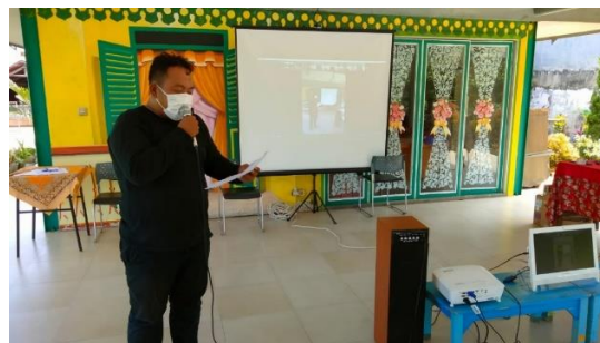
Gambar 1. Sambutan Panitia On-Site

Adapun dokumentasi dari pelaksanaan kegiatan Pelatihan Pengembangan Karakter Dalam Rangka Menghadapi Era Disrupsi Pada RPTRA Pola Idaman Cilandak, Jakarta Selatan adalah sebagai berikut: