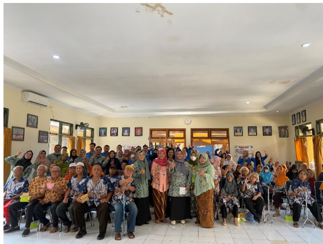
Gambar 3. Tim Penyuluhan bersama peserta

Pasien selama penyuluhan juga diberikan pertanyaan yang berisi pertanyaan seputar demensia dan diberikan kesempatan menanyakannya apabila belum tahu. Kegiatan dilanjutkan dengan konseling, pembagian doorprize dan terapi tawa untuk lansia agar peserta penyuluhan lebih semangat berinteraksi. Secara keseluruhan, kegiatan pengabdian masyarakat ini bertujuan untuk meningkatkan kualitas hidup lansia dan memberikan dukungan kepada mereka yang terkena dampak demensia serta lingkungan di rumah pelayanan sosial pucang gading semarang.