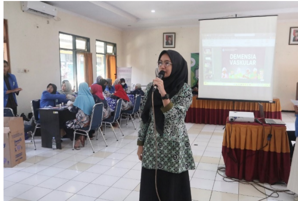
Gambar 1: Ketua Tim melakukan penyuluhan

Demensia atau mudah lupa sering dianggap wajar, terutama pada usia lanjut. Namun, penting untuk membedakan antara lupa yang normal dengan tanda-tanda awal demensia. Lupa yang normal biasanya tidak mengganggu aktivitas sehari-hari, sementara demensia menyebabkan penurunan kemampuan kognitif yang memengaruhi fungsi harian. Deteksi dini dan intervensi yang tepat sangat penting untuk menangani demensia dengan efektif. Program pengabdian masyarakat ini berfokus pada edukasi mengenai pentingnya penanganan dini. Pengabdian masyarakat ini dihadiri oleh 50 orang penghuni panti lansia baik pria maupun wanita. Para lansia sangat antusias untuk mengikuti kegiatan penyuluhan edukasi ini.