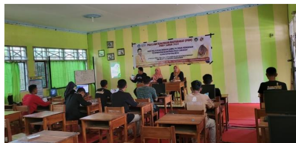
Gambar 2. Tim pengabdian memaparkan materi pelatihan

Sesi ini disampaikan hal-hal terkait elemen label dan yang harus diperhatikan dalam membaca label produk pangan. Hal ini perlu disampaikan agar mitra memahami apa saja yang dimuat nantinya dalam mendesain label kemasan produk yang sesuai dengan standar dan aturan. Selain itu, disampaikan juga pentingnya pemahaman mitra terkait informasi nilai gizi, komposisi bahan, tanggal kadaluarsa produk, dan informasi lain yang perlu ditampilkan dalam desain label nantinya.