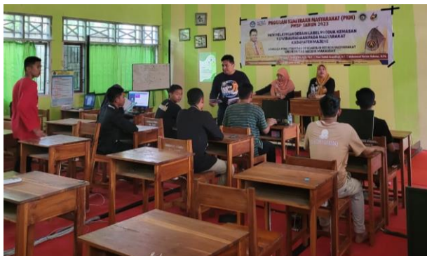
Gambar 3. Tim pengabdi menjelaskan tutorial cara membuat desain label kemasan

Tim pengabdi memberikan arahan dalam membuat akun melalui website Canva. Setelah itu, diberikan tutorial sederhana dalam membuat desain yang sesuai dengan kebutuhan mitra. Pada kesempatan ini, tim pengabdi memberikan tutorial membuat desain label produk kewirausahaan seperti pada Gambar 3.