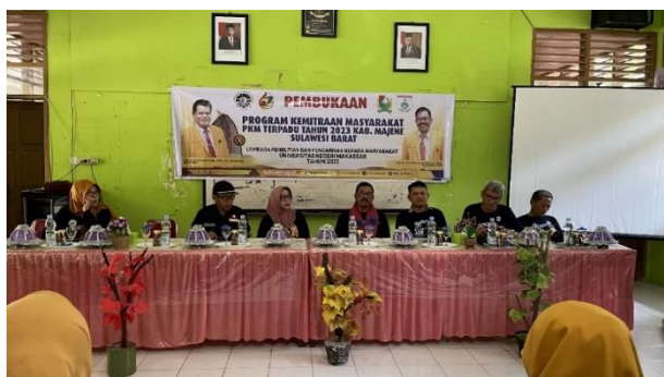
Gambar 1. Pembukaan kegiatan PKM

Pembukaan oleh Ketua LP2M, sambutan dari pihak mitra dalam hal ini Kepala Sekolah SMAN 1 Pamboang, dan pemerintah setempat yang diwakili oleh sekretaris Kecamatan Pamboang Kelurahan Lalampunua.