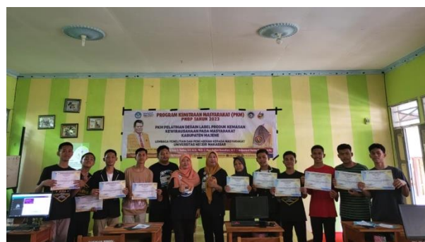
Gambar 6. Foto bersama setelah kegiatan PKM