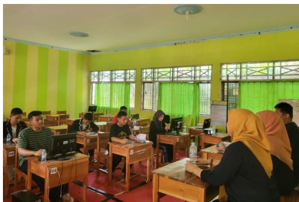
Gambar 4. Tim pengabdi menginstruksikan mitra untuk membuat desain

Setelah mitra menyimak materi dan tutorial, selanjutnya tim pengabdi memberikan instruksi untuk membuat desain masing-masing sesuai dengan jenis produk dan bentuk kemasan. Format desain yang dibuat berupa label produk kewirausahaan seperti pada Gambar 4.