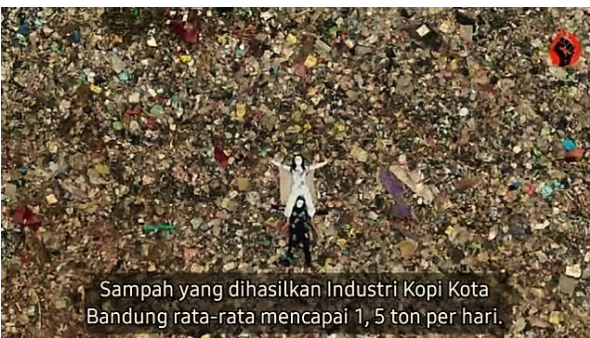
Gambar 4. Cuplikan data statistik sampah industri Kopi Kota Bandung.

Menganalisis makna denotasi dan konotasi dalam karya liputan “Hegemoni Industri Kopi”. Peneliti menemukan bahwa terdapat tanda atau simbol yang digunakan creator dalam menggambarkan keresahannya mengenai perkembangan industri kopi yaitu melalui kritik sosial yang dibalut dengan nilai estetika. Dalam