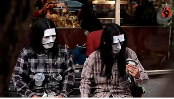
Gambar 2. Cuplikan performance art di beberapa kedai kopi di Kota Bandung.