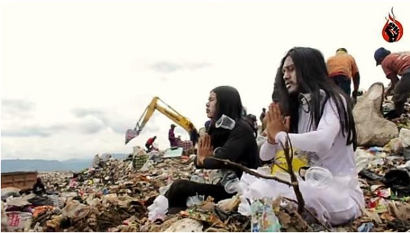
Gambar 3. Cuplikan performance art di TPA Sarimukti.