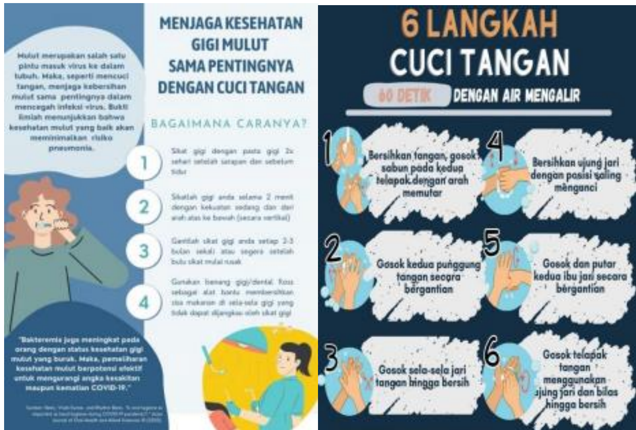
Gambar 1. Leaflet Edukasi