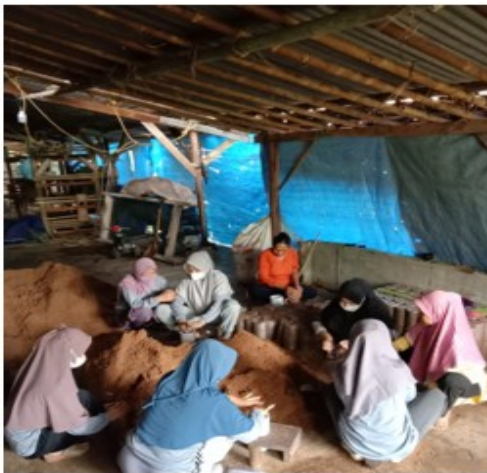
Gambar 1. Pembuatan Media Tanam