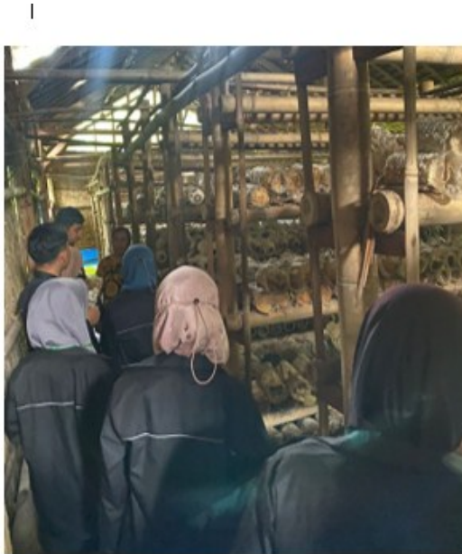
Gambar 4. Pemantauan Bahan Benih siap