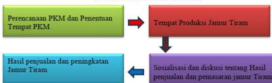
Gambar 1. Alur Pelaksanaan PKM

Dengan mengikuti alur ini, diharapkan program PKM budidaya jamur tiram dapat berjalan