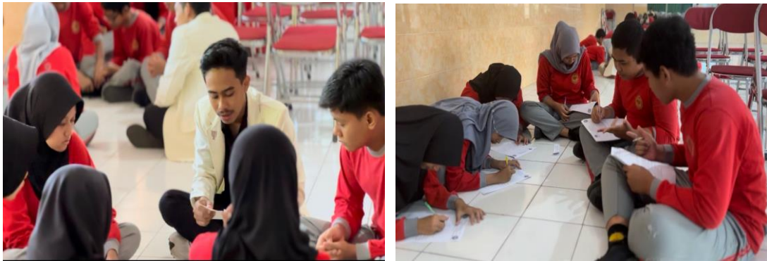
Gambar 3. Diskusi siswa dengan Metode PBL

Setelah melihat video, siswa dibagi menjadi 5 kelompok yang berisikan 6 orang per kelompoknya. Setelah pembagian kelompok, setiap kelompok diberi satu studi kasus dan siswa diberi arahan agar dapat memberikan solusi untuk kasus tersebut. Pada sesi ini merupakan tahapan dimana siswa belajar dari kasus yang diberikan ( Problem Based Learning ). Siswa di dalam kelompok dihantarkan terlebih dahulu oleh fasilitator kelompok sehingga dapat membaca dan memahami kasus yang disajikan tiap kelompok. Setelah diberi waktu untuk berdiskusi, salah satu siswa tiap kelompok maju untuk membacakan hasil diskusi mereka.