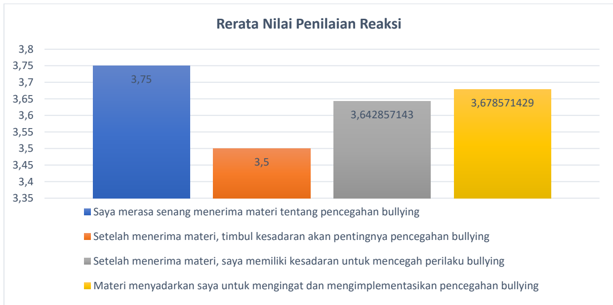
Gambar 4. Rerata nilai penilaian reaksi

Setelah melihat video, siswa dibagi menjadi 5 kelompok yang berisikan 6 orang per kelompoknya. Setelah pembagian kelompok, setiap kelompok diberi satu studi kasus dan siswa diberi arahan agar dapat memberikan solusi untuk kasus tersebut. Pada sesi ini merupakan tahapan dimana siswa belajar dari kasus yang diberikan ( Problem Based Learning ). Siswa di dalam kelompok dihantarkan terlebih dahulu oleh fasilitator kelompok sehingga dapat membaca dan memahami kasus yang disajikan tiap kelompok. Setelah diberi waktu untuk berdiskusi, salah satu siswa tiap kelompok maju untuk membacakan hasil diskusi mereka.