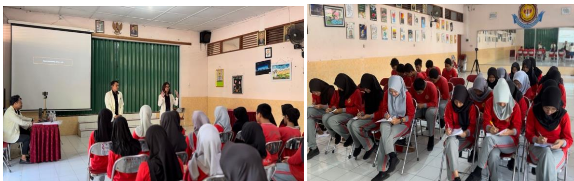
Gambar 2. Kegiatan Penyampaian Materi

Psikoedukasi "Cegah Bullying , Jaga Kesehatan Mental" telah sukses dilaksanakan di SMP Negeri 2 Boyolali pada tanggal 21 Juni 2024. Kegiatan ini diikuti oleh 26 siswa kelas VIII-B dan bertujuan untuk meningkatkan pemahaman mereka tentang bullying dan cara pencegahannya. Tim Pengabdian Masyarakat menggunakan berbagai metode untuk menyampaikan materi, seperti ceramah, video edukasi, ice breaking , problem based learning , dan LKPD. Siswa menunjukkan antusiasme dan keaktifan dalam mengikuti kegiatan, dan hasil evaluasi menunjukkan bahwa mereka memiliki pemahaman yang lebih baik tentang bullying setelah mengikuti psikoedukasi. Kegiatan ini bermanfaat bagi peserta didik untuk meningkatkan kesejahteraan mental dan emosional mereka, menciptakan lingkungan belajar yang aman dan nyaman, dan membangun interaksi sosial yang positif. Berdasarkan evaluasi reaksi siswa, dapat diketahui bahwa sebagian besar siswa telah menilai materi yang disajikan dalam pelatihan ini telah sesuai kebutuhan siswa, disampaikan dengan jelas, dan menggunakan metode yang menarik.