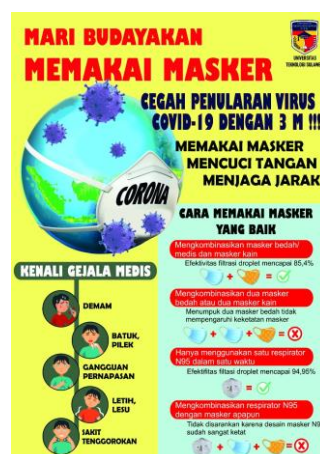
Gambar 4. Selebaran yang Berisi Informasi Pentingnya Menggunakan Masker di Masa Pandemi Covid-19

Pada hari Rabu, tanggal 28 Juli 2021, tim Pengabdian kepada Masyarakat mendatangi Kantor Lurah Pandang untuk bertemu langsung dengan Pak Lurah dan meminta izin untuk mengadakan kegiatan dengan anak – anak jalanan di Jalan Pengayoman. mengadakan kegiatan dengan anak – anak jalanan di Jalan Pengayoman.