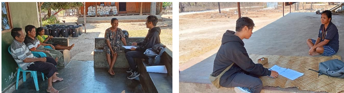
Gambar 3. Pendampingan Ibu Rumah Tangga Terkait Manajemen Keuangan Keluarga

Pendampingan masyarakat kembali dilakukan dua minggu setelah sosialisasi disampaikan. Hal ini bertujuan untuk melihat terjadinya perubahan perilaku masyarakat (ibu rumah tangga) dalam mengatur dan mengelola keuangan keluarganya. Pendampingan dilakukan dengan kunjungan ke rumah masing-masing ibu rumah tangga pada tanggal 17 sampai dengan 18 Oktober 2023 oleh mahasiswa.