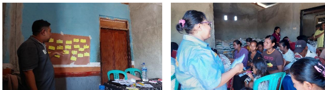
Gambar 2. Penyampaian Materi dan Pemetaan Jawaban Pada Saat Diskusi di Desa Maubokul

Survei terhadap pelaksanaan sosialisasi memuat tujuh indikator penilaian, terkait waktu pelaksanaan, kegiatan sesuai dengan kebutuhan masyarakat, pelayanan panitia pelaksana, ruangan kegiatan, serta narasumber. Hasilnya dapat dilihat pada tabel di bawah ini: