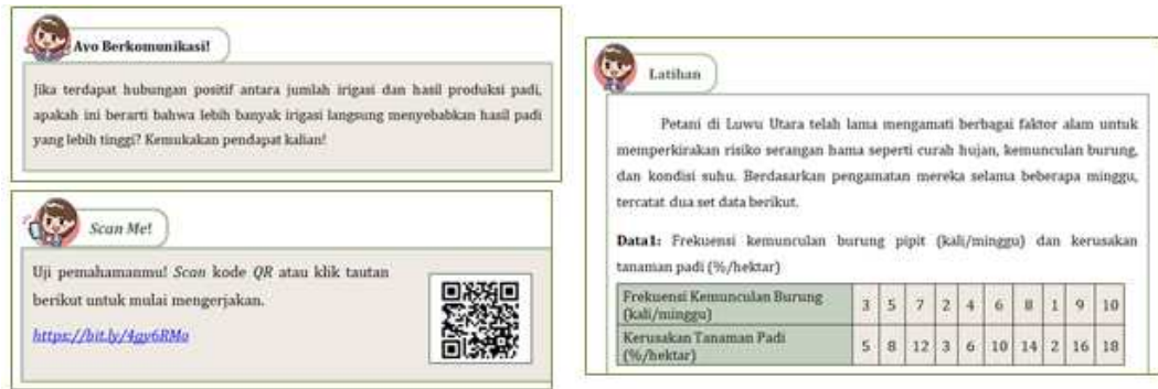
Gambar 2. Tampilan E-Modul Pembelajaran

Tahap implementasi e-modul pembelajaran dilakukan melalui uji coba kelompok kecil dan kelompok besar untuk menilai kepraktisan dan keefektifan produk dalam kondisi pembelajaran nyata. Uji coba kelompok kecil melibatkan 10 peserta didik dan tidak menemukan kendala signifikan, meskipun guru memberikan saran perbaikan berupa peringkasan pengantar soal latihan serta penambahan logo Kurikulum Merdeka dan logo sekolah pada sampul e-modul. Selanjutnya, uji coba kelompok besar melibatkan 23 peserta didik kelas XI selama empat pertemuan dengan menerapkan model Flipped Classroom , yang memadukan pembelajaran mandiri di rumah dan diskusi aktif di kelas. Pendekatan ini didukung oleh Danuri et al. (2024) yang menyatakan bahwa Flipped Classroom efektif dalam menumbuhkan kemandirian belajar serta memfasilitasi pengembangan kemampuan berpikir kritis dan komunikasi matematis. Selain itu, Nurjannah et al. (2022) juga mengonfirmasi bahwa Flipped Classroom berdampak baik pada pencapaian prestasi belajar matematika dan keaktifan belajar peserta didik.