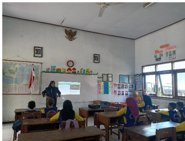
Gambar 1. Penerapan Game Educaplay di SDN 3 Lengkong

Penerapan game educaplay yang ada di SDN 3 Lengkong tidak hanya membantu siswa dalam proses belajar tetapi juga berdampak bagi guru. Dimana guru terbantuan dengan adanya inovasi dalam media pembelajaran melalui game educaplay yang memanfaatkan kemajuan teknologi digital. Penerapan game educaplay seperti pada gambar berikut: