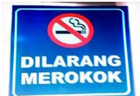
Gambar 3. L07: Larangan merokok pada area tertentu