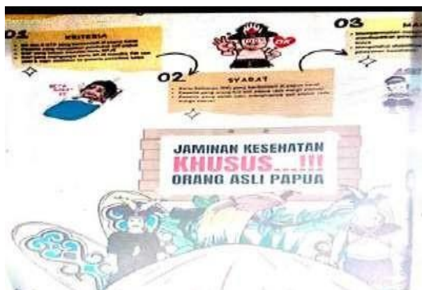
Gambar 8. L04: Informasi jaminan kesehatan khusus OAP

Informasi tempat sampah infeksius bertujuan untuk mencegah penularan penyakit, mencegah infeksi nosokomial, dan untuk mencegah cedera pada petugas medis. Informasi tentang tempat hazardous materials sangat penting karena bahan berbahaya ini sering mengandung darah dan cairan tubuh yang sangat bahaya. Selain informasi tentang tempat, terdapat juga lanskap linguistik yang menginformasikan tentang informasi layanan masyarakat terkait dengan keberadaan jaminan layanan kesehatan khusus untuk orang asli papua (OAP), sebagaimana dapat dilihat pada lanskap L04 berikut.