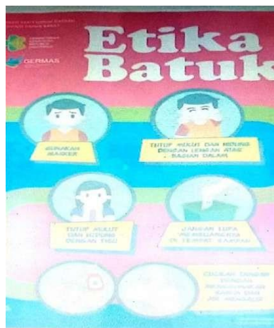
Gambar 9. L13: Prosedur (tata cara) berbatuk

Fungsi lanskap kesehatan di lingkungan RSUD Provisnsi papua Barat yang ketiga adalah sebagai lanskap prosedur, yaitu lanskap yang menjelaskan cara mnegerjakan sesuatu. Terdapat 2 lanskap prosedur yang berkaitan dengan kesehatan, sebagaimana dapat dilihat pada lanskap L13 dan L14. Lanskap prosedur batuk atau sering disebut etika batuk sangat penting diinformasikan di rumah sakit untuk mencegah penyebaran penyakit menular yang dapat menular melalui droplet dari pasien, pengunjung, dan tenaga medis. Beberapa penyakit menular dapat menyebar dengan cepat seperti TBC dan influenza. Selain lanskap prosedur batuk yang benar, terdapat juga lanskap linguistik prosedur membersihkan tangan, seperti dapat dilihat pada lanskap L14.