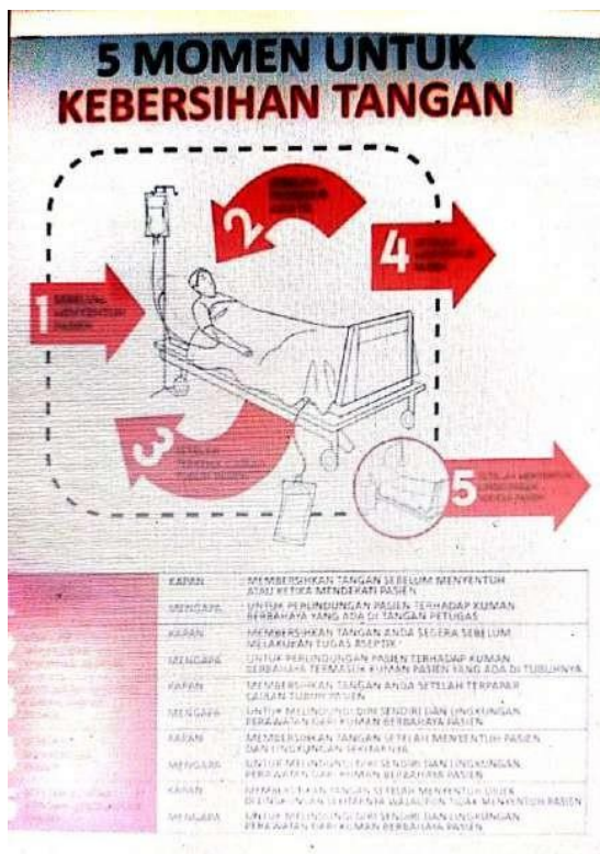
Gambar 10. L14: Prosedur/tata cara membersihkan tangan dengan benar

Membersihkan atau mencuci tangan adalah hal yang lazim kita lakukan dalam kehidupan sehari-hari. Namun, tata cara mencuci tangan yang benar belum tentu setiap orang mengetahuinya. Oleh sebab itu penjelasan tentang tata cara tersebut perlu disampaikan kepada masyarakat. Hal demikian juga berlaku di rumah sakit. Cuci tangan di rumah sakit sangat penting untuk mencegah penyebaran kuman terutama kuman yang sering resisten terhadap antibiotik.