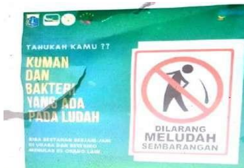
Gambar 1. L01: Larangan meludah di area tertentu

Larangan meludah di sembarang tempat telah menjadi lanskap linguistik yang sangat umum di rumah sakit. Larangan seperti ini telah menjadi syarat dalam kelengkapan rumah sakit. Meludah sembarangan di rumah sakit dilarang karena alasan kesehatan. Rumah sakit merupakan tempat berkumpulnya orang sakit sehingga penyebaran kuman dan infeksi melalui air liur sangat mudah terjadi.