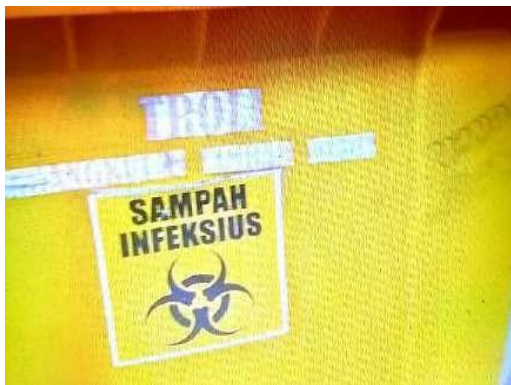
Gambar 7. L03: Informasi tempat sampah infeksius

Provinsi Papua Barat terdiri dari informasi tempat, informasi layanan, dan informasi keberadaan pasien penyakit menular. Contoh informasi tempat dapat dilihat pada lanskap L03 berikut.