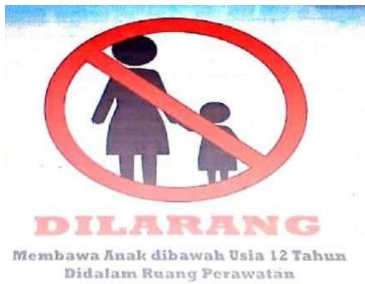
Gambar 2. L06: Larangan Membawa Anak di bawah umur pada area tertentu