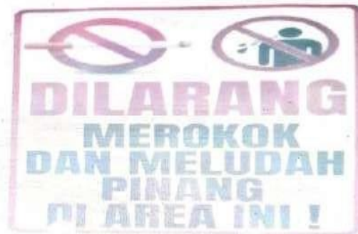
Gambar 6. L11: Larangan merokok dan meludah pinang pada area tertentu

Pada area-area tertentu di rumah sakit tidak semua orang dibolehkan melewati area tersebut, misalnya ruang IGD, seperti yang terdapat pada lanskap L10 di atas. Larangan ini bertujuan untuk menjaga keamanan, sterilitas, dan kelancaran penanganan pasien kritis. Pembatasan akses ini penting untuk menyelamatkan nyawa pasien yang harus ditangani dengan cepat dan hati-hati.