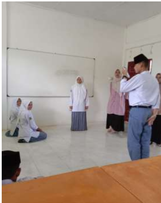
Gambar 5: Latihan oleh Siswa-siswi Aliyah Daarul Falah