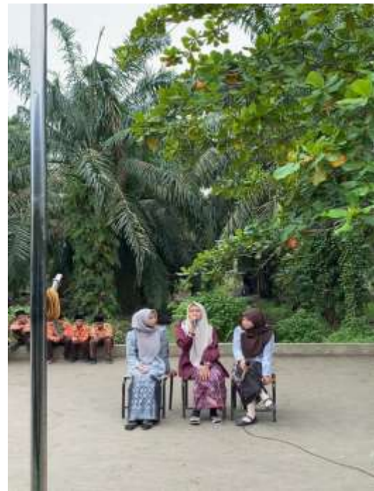
Gambar 6: Penampilan Drama oleh Siswa-siswi Aliyah Daarul Falah