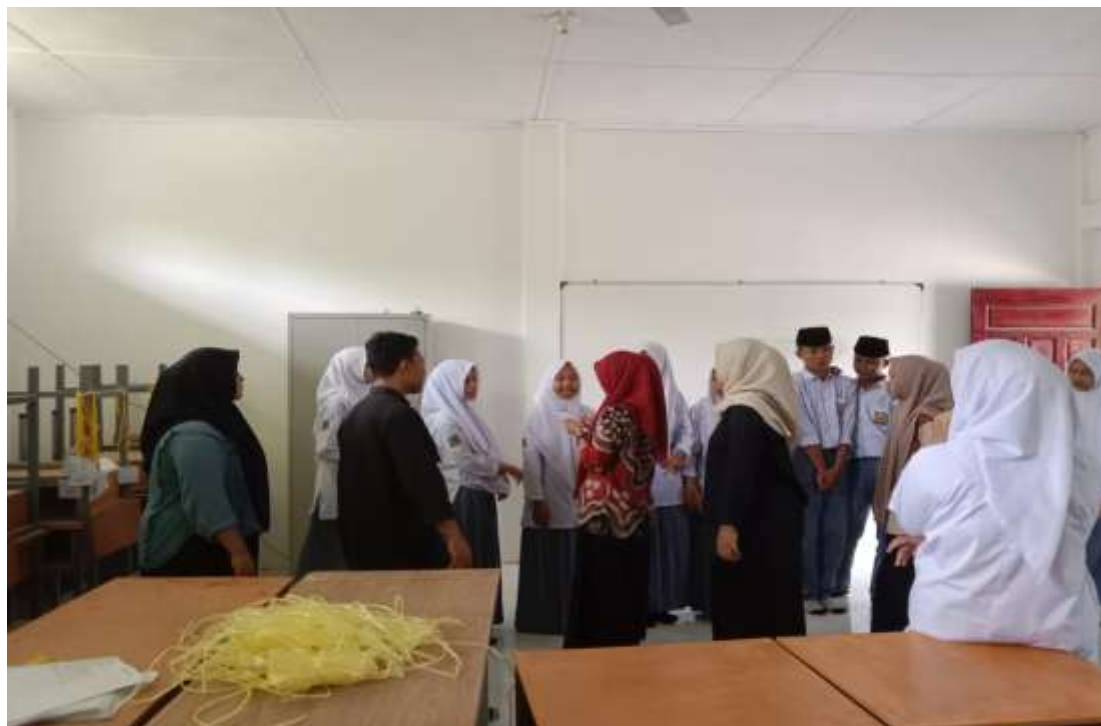
Gambar 1: Proses Pemilihan Peran Musikalisasi Drama

Doi : https://doi.org/10.47709/ppi.v3i03.6984