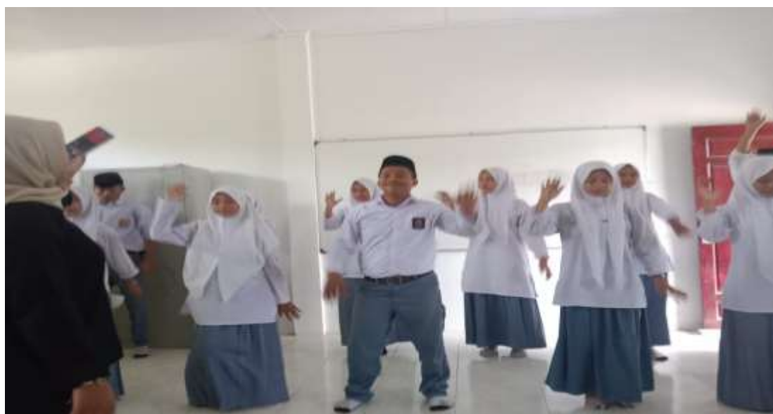
Gambar 2: Proses Peregangan Sebelum Fase Pelatihan