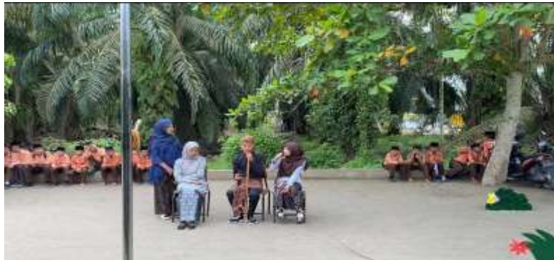
Gambar 7: Penampilan Drama oleh Siswa-siswi Aliyah Daarul Falah

Secara keseluruhan, kegiatan pengabdian masyarakat ini berjalan dengan lancar dan memperoleh respon positif. Antusiasme siswa terlihat dari keaktifan mereka dalam setiap sesi latihan, meningkatnya jumlah peserta yang konsisten hadir, serta keberanian mereka untuk tampil dalam pementasan. Kehadiran mahasiswa PLPT tidak hanya memberikan pengalaman belajar baru bagi siswa, tetapi juga memperkuat hubungan antara perguruan tinggi dan sekolah sebagai mitra dalam mengembangkan potensi generasi muda melalui kegiatan ekstrakurikuler seni.