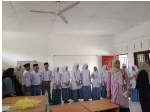
Gambar 3 Dan 4: Pemberian Arahan oleh Kakak-kakak Mahasiswa PLPT