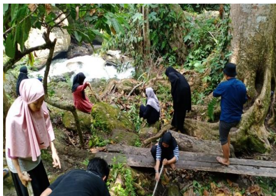
Gambar 5. Membersihkan Sungai Langonde

Pada tanggal 20 september 2020 mahasiswa melakukan kegiatan membersihkan tempat wisata sungai langonde di Desa Lapao-pao. Kegiatan dilakukan dengan membersihkan sampah-sampah disekitar sungai. Hal ini dilakukan agar air sungai tidak tercemar. Pencemaran serta tercemarnya air sungai tidak hanya merugikan masyarakat yang mendiami daerah sekitar sungai saja akan tetapi akan membawa dampak-dampak negatif bagi masyarakat lain yang berada disepanjang aliran sungai tersebut (Puspitasari, 2009). Selain itu, pencemaran air sungai yang kontaminasi sampah dapat mengganggu perkembangan dan kelangsungan hidup satwa di sungai (Priambudi & Utami, 2020).