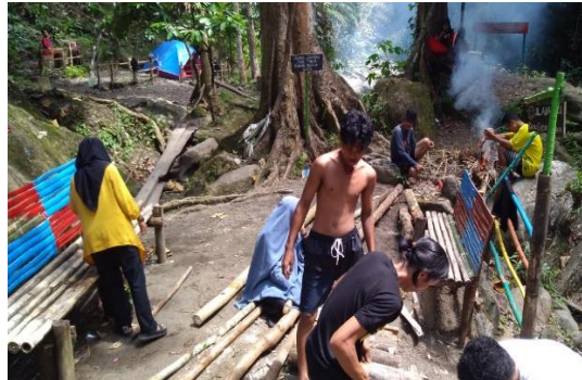
Gambar 6. Pembuatan Kursi Taman

taman di tempat wisata sungai langonde Desa Lapao-pao bertujuan sebagai tempat duduk dan beristirahat adapun manfaatnya membuat para pengunjung merasa nyaman di tempat wisata sungai langonde Desa Lapao-pao.