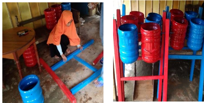
Gambar 3. Pembuatan Tong Sampah

Pada tanggal 16 september 2020 mahasiswa melakukan program kerja yaitu membuat tong sampah organik dan anorganik yang nantinya akan dipasang ditempat-tempat umum diDesa Lapao-pao. Kegiatan ini dilaksanakan selama dua hari, lokasi pembuatan diposko KKN dan pemasangan/finising dilakukan pada tanggal 23 september 2020. Pada tanggal 23 september 2020 mahasiswa melanjutkan program kerja pembuatan tong sampah organik dan anorganik yaitu pemasangan ditempat-tempat umum seperti masjid, kantor kelurahan dan posyandu Desa Lapao-pao.