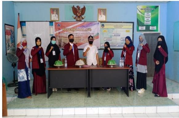
Gambar 2. Seminar Program Kegiatan

Pada tanggal 16 september 2020 mahasiswa melakukan program kerja yaitu membuat tong sampah organik dan anorganik yang nantinya akan dipasang ditempat-tempat umum diDesa Lapao-pao. Kegiatan ini dilaksanakan selama dua hari, lokasi pembuatan diposko KKN dan pemasangan/finising dilakukan pada tanggal 23 september 2020. Pada tanggal 23 september 2020 mahasiswa melanjutkan program kerja pembuatan tong sampah organik dan anorganik yaitu pemasangan ditempat-tempat umum seperti masjid, kantor kelurahan dan posyandu Desa Lapao-pao.