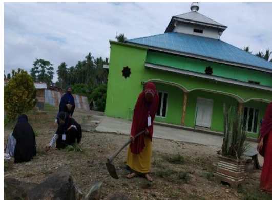
Gambar 4. Operasi Bersih Masjid

operasi bersih masjid di Desa Lapao-pao. Kegiatan ini dilakukan dengan membersihkan daerah disekitar mesjid dengan memungut sampah dan memotong rumput.