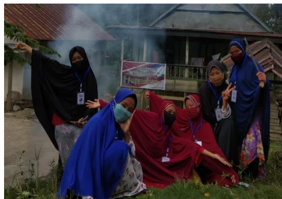
Gambar 7. Membersihkan Desa

Pada tanggal 24 september 2020 mahasiswa melanjutkan program kerja yaitu membuat kursi taman di tempat wisata sungai langonde Desa Lapao-pao. Kegiatan ini merupakan finalisasi kursi-kursi taman yang belum di cat pada tanggal 22 September 2020. Selanjutnya, pada tanggal 30 september mahasiswa melakukan gotong royong bersih bersih desa yaitu membersihkan pinggir jalan dan perkarangan halaman rumah-rumah Desa Lapao-pao. Kegiatan ini dibantu oleh warga sekitar dengan tujuan menjalin kebersamaan mahasiswa KKN dengan warga Desa Lapao-pao.