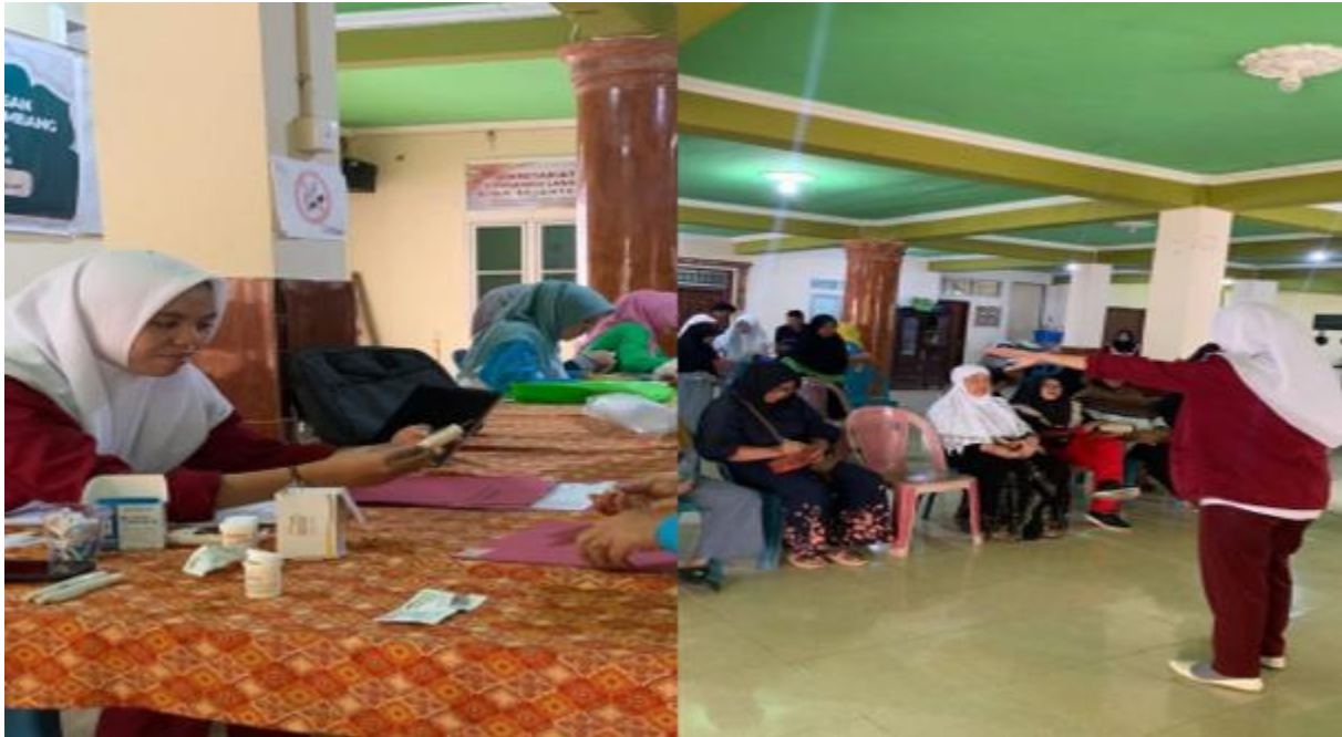
Gambar 1. Dokumentasi Kegiatan Pengabdian kepada Masyarakat