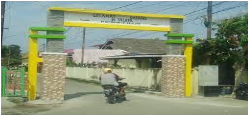
Gambar 1. Gapura Masuk Desa Bandar Agung Kec. Lubuk Batang

Dari hasil kunjungan ke tempat industri kopiah Resam bapak M. Abdul Gony ada beberapa permasalahan yang dihadapi yaitu terletak pada pemasaran. Pada aspek pemasaran indutri kopiah Resam hanya mengandalkan pemasaran secara tradisional, yaitu dari toko ke toko dan mulut ke mulut. Sehingga jangkauan konsumen masih relatif sedikit. strategi pemasaran belum memanfaatkan internet marketing , dikarenakan belum adanya informasi cara memanfaatkan internet sebagai strategi pemasaran. Perlu adanya pemasaran online untukmemperluas pasar dari produksi kopiaah Resam. Hal ini sesuai paper [1] dalam pemasaran online mempunyai banyak keuntungan Diantaranya murah nya biaya dalam pemasaran dan transaksi jual beli. yang mana modal masih menjadi kendala bagi wirausaha dalam menjalankan usahanya [2]. Melihat perkembangan digitalisasi yang semakin semarak dan memasuki berbagai kalangan masyarakat. Inovasi sebagai solusi permasalahan tersebut perlu diterapkan internet marketing sebagai strategi pemasaran. Inovasi mampu memberikan nilai positif bagi pelaku UMKM, terutama dimasa new normal dengan melihat menurunnya minat konsumen maka dibutuhkan inovasi baru untuk meningkatkan ketertarikan konsumen dan mencari pangsa pasar baru. [3] dengan inovasi mampu meningkatkan nilai value suatu barang [4].