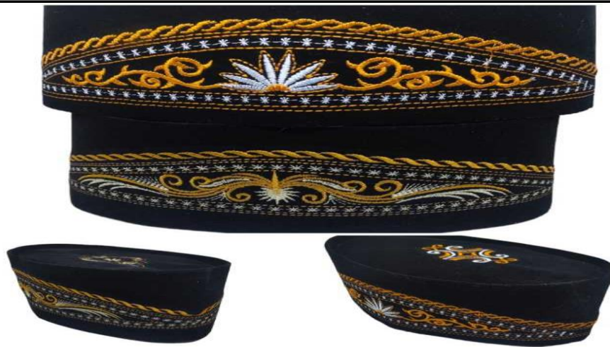
Gambar 2. Salah Satu Kopiah Buatan Bapak M. Abdul Ghony

Internet marketing yaitu usaha perusahaan dalam menjalin hubungan dengan konsumen melalui media internet untuk mempromosikan barang dan jasanya. Dalam peper [5] Digital Marketing merupakan suatu proses perencanaan dan pelaksanaan dari konsep, ide, harga, promosi dan distribusi. Media yang digunakan merupakan situs umum yang jaringan komputernya sangat besar dengan tipe berbeda di seluruh Dunia yang terhubung dalam satu wadah. Strategi internet marketing yang dibangun sebagai strategi pemasaran industri kopiah Temboro yaitu website pemasaran E-commerce dan memanfaatkan sosial media yang berbasis bisnis[6]. Dengan adanya E commerce mamapu meningkat Ewom bagi masyarakat. meningkatkan E-WOM yang mana E-WOM mampu menyebarkan informasi melalui media online atau Internet, seperti email, blog, ruang obrolan, Facebook, Twitter dan berbagai jenis jejaring sosiallainnya[7]