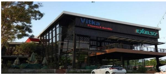
Gambar 2 Excelso Kota Batam

Lokasi penelitian ini dilakukan di Cafe Excelso Vitka Point Tiban Kota Batam Jl. Gajah Mada, Tiban Lama, Kec. Sekupang, Kota Batam, Kepulauan Riau 29426.