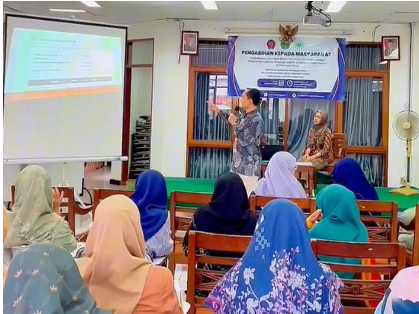
Gambar 2. Suasana Pelatihan Abdimas Pelaku UMKM Perempuan PWA Jawa Barat

peserta terkait materi transformasi keuangan digital kepada para pelaku UMKM perempuan berkemajuan melalui g-form . Suasana saat pemberian materi mengenai transformasi keuangan digital oleh instruktur abdimas sebagaimana terlihat pada gambar 2.