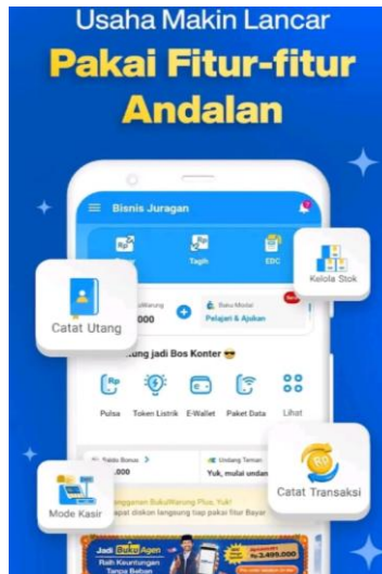
Gambar 3. Tampilan Menu Utama Platform BukuWarung

Gambar 4 di bawah ini menunjukkan ragam produk hasil usaha kreatifitas pelaku UMKM perempuan PWA Jawa Barat.