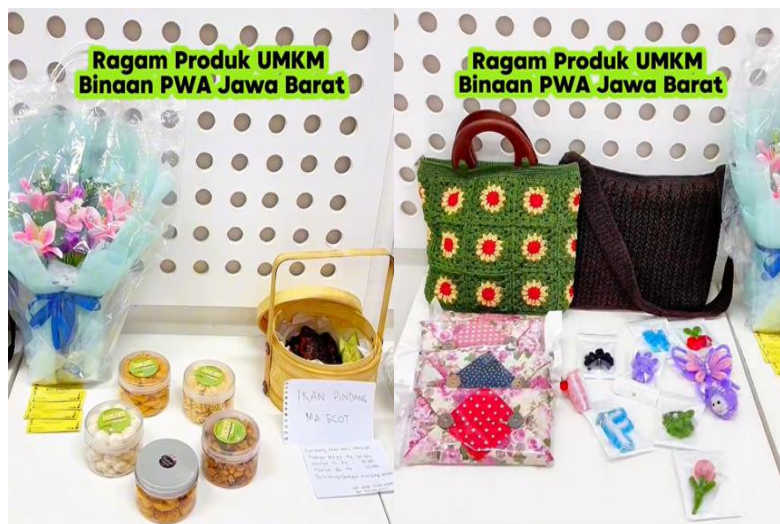
Gambar 4. Ragam Produk UMKM Perempuan PWA Jawa Barat

Gambar 4 di bawah ini menunjukkan ragam produk hasil usaha kreatifitas pelaku UMKM perempuan PWA Jawa Barat.