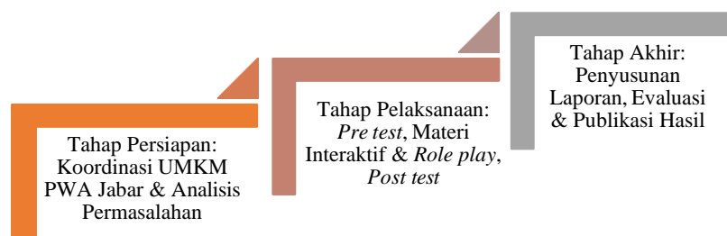
Gambar 1. Tahapan Kegiatan Abdimas Pelaku UMKM Perempuan Berkemajuan PWA Jawa Barat

Secara garis besar, tahapan dari kegiatan abdimas yang dilaksanakan dapat dilihat pada gambar 1 di bawah ini: