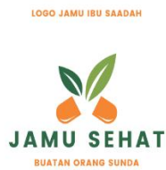
Output logo usaha