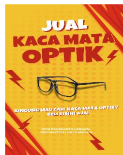
Output Pamflet Promosi Online