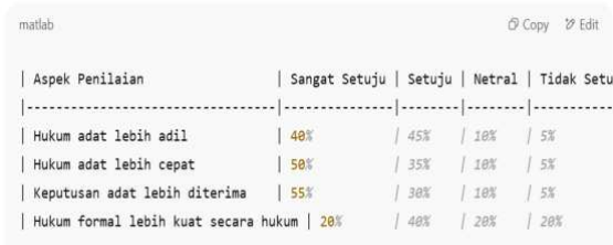
Gambar 1. Persepsi Masyarakat terhadap Efektivitas Hukum Adat

Untuk memperkuat temuan wawancara, dilakukan kuesioner terhadap 50 anggota masyarakat adat yang pernah atau sedang terlibat dalam sengketa tanah. Hasil kuesioner menunjukkan kecenderungan berikut: