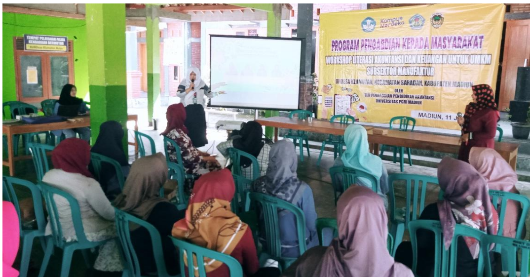
Gambar 12. Pemaparan Materi oleh Tim Pengabdian

diberikan dengan pemberian contoh soal sederhana yang harus dijawab oleh ibu-ibu peserta. Agar ibu-ibu semakin paham, kertas kerja dan bolpoin dibagikan untuk uji coba (Gambar 13). Mereka tampak antusias menjawab dan jawabannya benar. Hal ini merupakan indikator positif produk tim pengabdian diterima masyarakat sasaran.