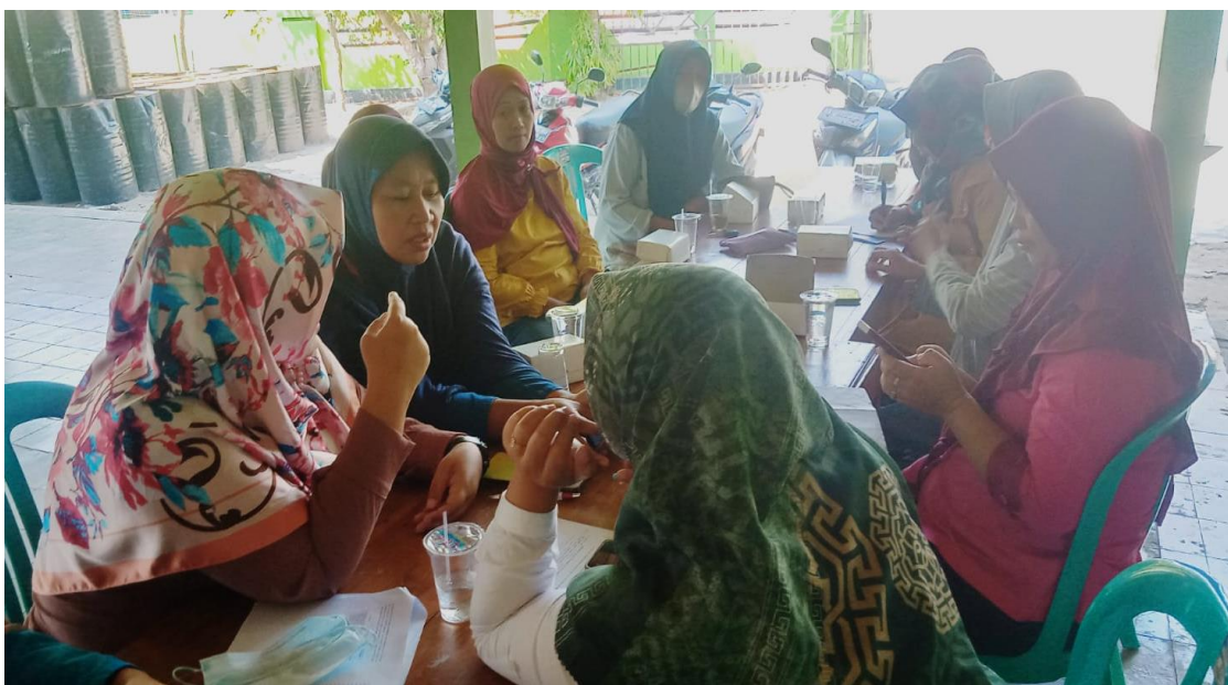
Gambar 6. Kondisi Wawancara dan Diskusi Pra Workshop

Padahal tenda dan kompor seharusnya merupakan jenis aset. Perhitungan keuntungan adalah pendapatan dikurangi beban.