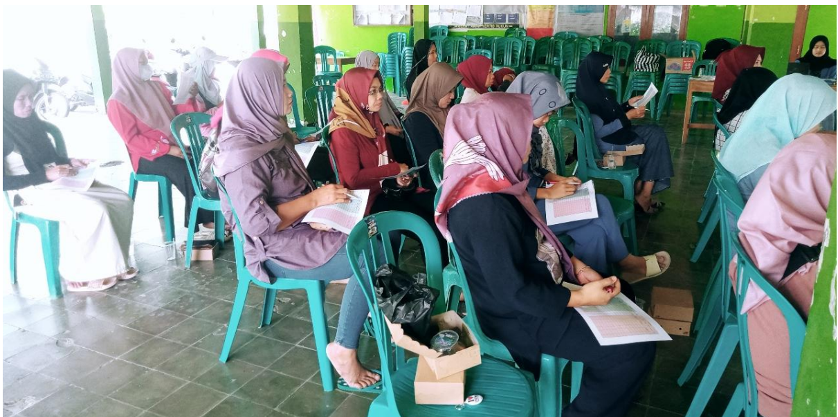
Gambar 13. Uji Coba Pengisian Buku Titip Jual Puspa Pinunjul