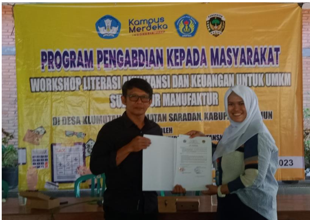
Gambar 11. Penyerahan MoU dan MoA