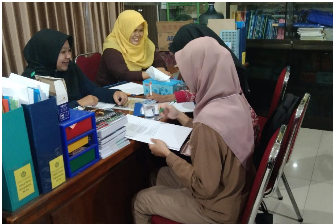
Gambar 7. Diskusi Internal Tim Pengabdian

Setelah itu, tim pengabdian merancang catatan dan laporan keuangan sederhana bagi UMKM sesuai karakteristik usaha dan kebutuhan (Gambar 7). Tim menciptakan Buku Titip Jual Puspa Pinunjul dengan tampilan pada Gambar 8. Untuk melengkapi langkah-langkah pencatatan dari awal, bagan alir proses titip jual juga dibuat (Gambar 9). Ringkasan proses ini merupakan pertama dan satu-satunya yang diciptakan dari dan untuk Kelompok UMKM Puspa Pinunjul, dibuktikan dengan HKI nomor 000493492.