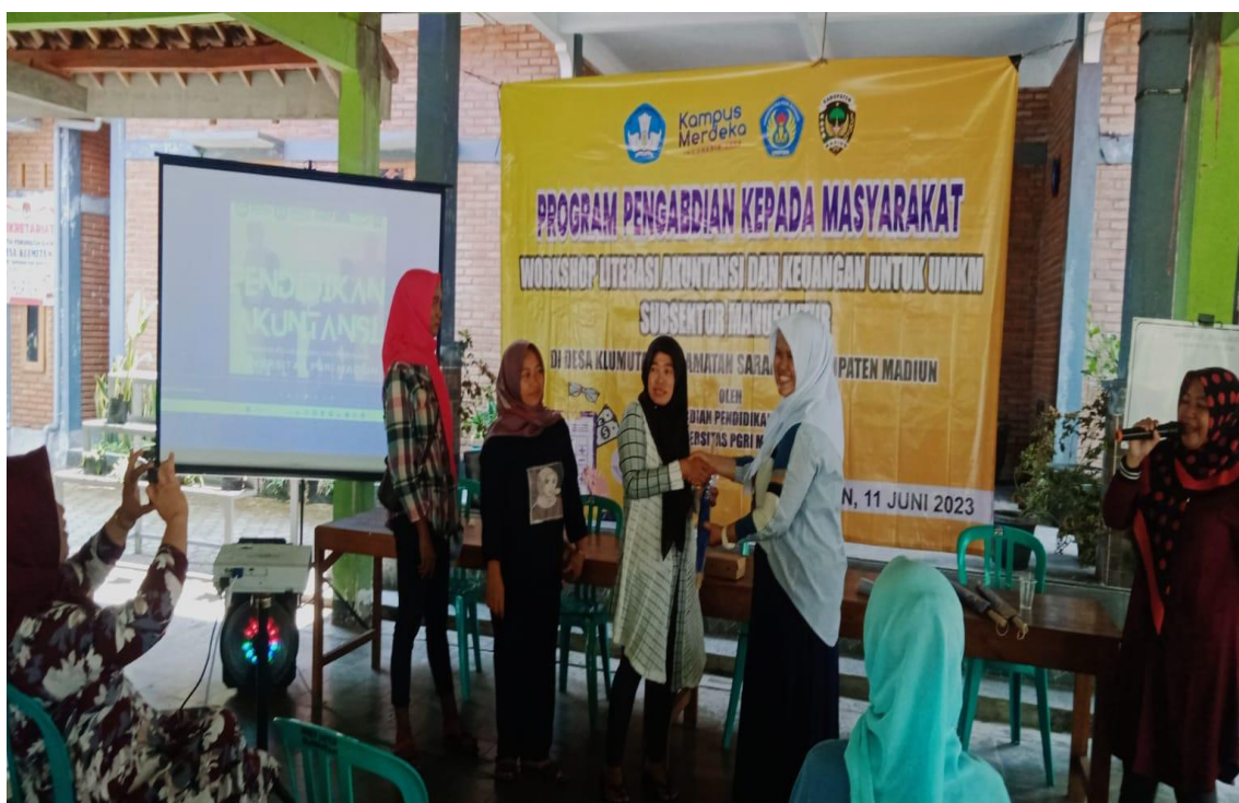
Gambar 14. Penyerahan Hadiah Undian

Pengisian posttest dilakukan untuk menilai pemahaman setelah pemberian materi, serta respon peserta terhadap kegiatan pengabdian. Hasilnya untuk uji pengetahuan ada peningkatan nilai sebesar 22,14% dari rata-rata nilai pretest 7,71 menjadi 9,41 pada posttest . Agar ibu-ibu lebih semangat mengisi kuesioner dan tes, doorprize berupa payung diundi (Gambar 14).