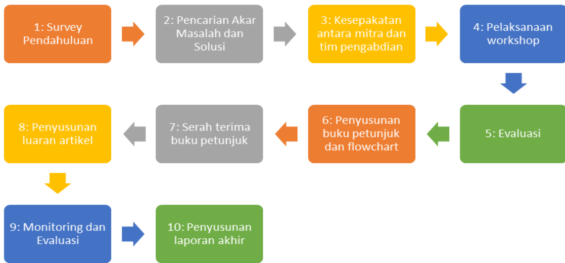
Gambar 1. Tahapan Pengabdian Masyarakat di Kelompok UMKM Puspa Pinunjul