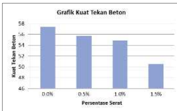
Gambar 2. Grafik Hasil Pengujian Kuat Tekan Beton

Pengujian kuat tekan beton dilakukan sesuai dengan umur rencana yaitu pada umur beton 28 hari. Data hasil pengujian kuat tekan beton silinder pada umur 28 hari dapat dilihat pada Tabel 5 dan grafik kuat tekannya dapat dilihat pada Gambar 2 di bawah ini.