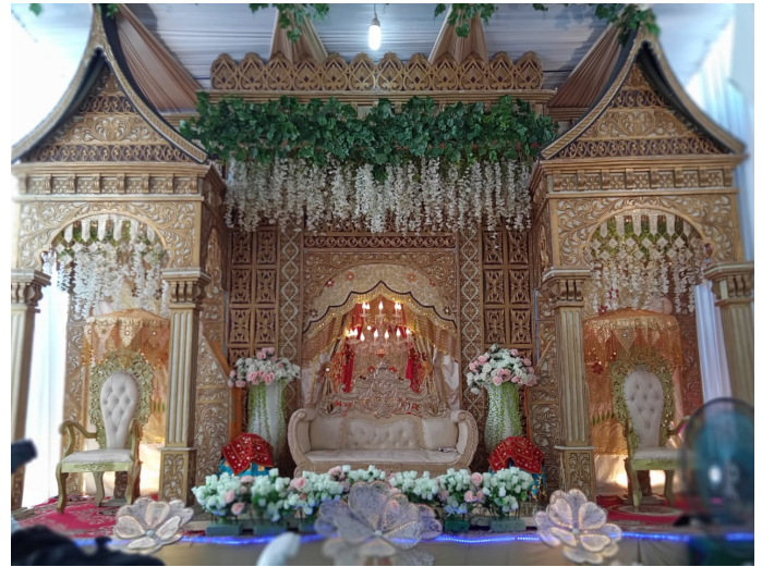
Gambar 1. Pelaminan Minangkabau

Ragam hias yang terdapat pada banta gadang pelaminan minangkabau daerah Saniangbaka merupakan gambaran bentuk dari alam, secara dekoratif akan memberikan nilai estetis yang memiliki makna dan arti serta menggambarkan nilai-nilai kehidupan masyarakat, seperti yang terdapat dalam falsafah adat minangkabau salah satunya alam takambang jadi guru , belajar dari alam sekitar yang menjadi kan tumbuhan dan hewan sebagai sumber inspirasi dalam menciptakan suatu seni kriya. Ragam hias yang terdapat pada setiap komponen pelaminan merupakan gambaran bentuk alam, sesuai dengan falsafah alam takambang jadi guru , yang bermakna belajar dari alam [12].