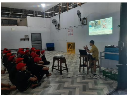
Gambar 2. Pemberian Materi

Pada hari dilaksanakannya pelatihan, para peserta pelatihim sangat bersemangat mengikuti acara ini, terbukti dengan antusiasnya para peserta dan banyaknya pertanyaan dari para peserta