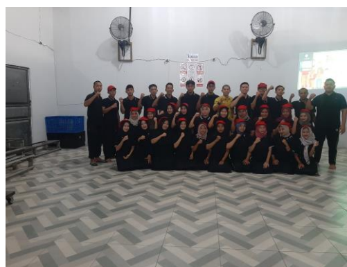
Gambar 3. Foto Bersama

Dari tabel 2 dan tabel 3 dapat dilihat peningkatan banyaknya penjualan sebanyak 40%, penurunan biaya operasional sebanyak Rp 200.00/ bulan atau 20% dan peningkatan jangkauan pasar sebanyak 2 kabupaten/kota. Sehingga dapat dikatakan pelatihan dan pendampingan secara intensif ini berhasil.