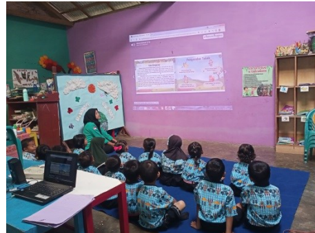
Gambar 2. Penggunaan Media Buku Cerita Digital Di Kelompok A Berdasarkan hasil ketercapaian

Setelah produk media buku cerita ini jadi sesuai dengan kriteria dari para ahli, kemudian media di uji cobakan pada guru dan peserta didik di kelompok A yang berjumlah 16 anak. Kemudian peneliti memberikan instrumen uji coba yang telah disusun pada tahap sebelumnya. Saran dari guru wali kelas dan peserta didik kelompok A menjadi bahan pertimbangan untuk melakukan revisi agar menjadi lebih layak dari sebelumnya.