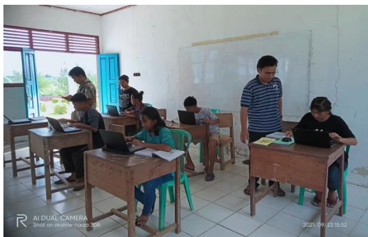
Gambar 3. Pelaksanaan Penggunaan komputer

Siswa SMP Negeri 2 Siberut Utara berpendapat bahwa dengan adanya pelatihan penggunaan dan pengenalan perangkat komputer sangat membantu mereka dalam menghadapi ANBK. Siswa menyebutkan dengan adanya pelatihan secara rutin maka mereka akan terbiasa ketika berada di hadapan komputer dan tidak merasa canggung dalam menggunakan komputer. Proses pelatihan yang dilaksanakan dapat dilihat pada gambar 2 berikut ini.