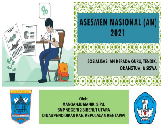
Gambar 2. Sosialisasi ANBK

ANBK ke dalam slide powerpoint pada gambar di bawah ini.