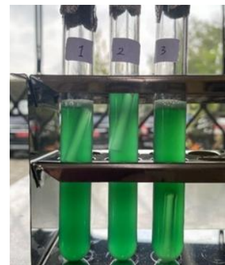
Gambar 2. Hasil positif uji penegasan