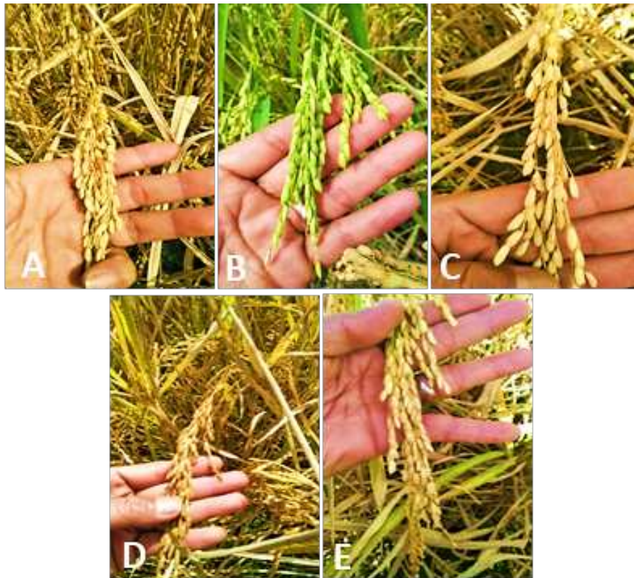
Gambar 2. Penampilan bulir dan malai genotipe padi sawah lokal asal Sumatera Barat ; Kuriak Putih (A), Cantik Manis (B), Kusuik Putih (C), Kuriak Kusuik (D), dan Ampek Bulan Putih (E).

Lebih lanjut Li, Tang, et al., (2021), berat butir ditentukan oleh ukuran butir (panjang, lebar, dan tebal serta kecepatan pengisian butir).