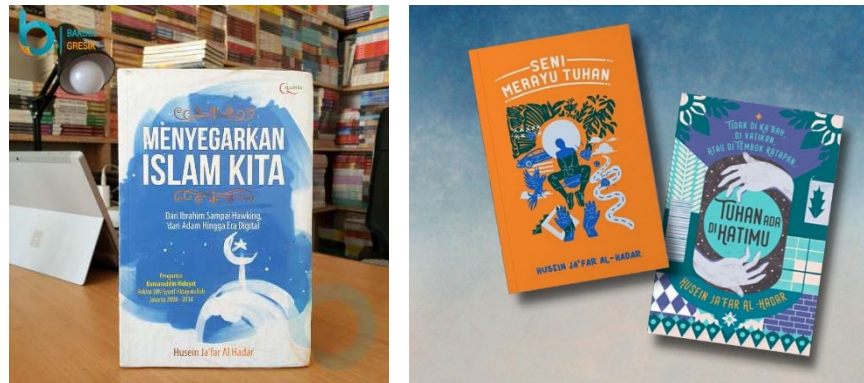
Gambar 1. Buku Tulisan Habib Husein Ja'far

Selain menulis, Habib Husein Ja'far juga memiliki Chanel YouTube bernama “Jeda Nulis” sebagai media dakwah yang ruang lingkupnya lebih luas dari pada ceramah di mimbar-mimbar masjid. Menurut Habib Husein Ja'far di era sekarang penyampaian melalui video lebih diminati. Habib ja'far juga aktif di berbagai platfrom untuk mengisi acara, podcats dan lainnya. Habib husein ja'far banyak digemari karna penyampaian dakwahnya terkesan tidak menggurui dan bahasa yang digunakan sederhana serta dibalut dengan komedi yang tentunya tidak bertentangan dengan agama islam.