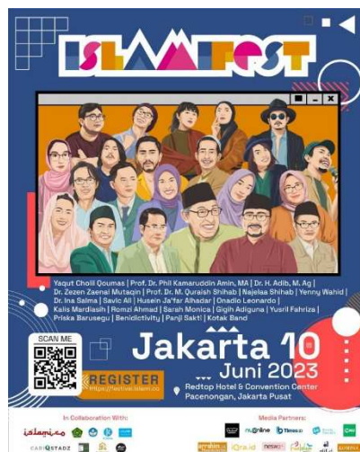
Gambar 5. Poster Log In Offline di Islami Fest 10 Juni 2023

Pendekatan inklusif dan dialogis dalam Log In telah berkontribusi besar dalam menghidupkan nilai toleransi melalui dialog antar agama, yang menunjukkan bahwa perbedaan keyakinan tidak menjadi penghalang untuk berdiskusi dan saling memahami. 10 Dalam podcast Log In , banyak nilai toleransi yang disampaikan, salah satunya adalah pentingnya menghormati keyakinan orang lain. Pesan yang disampaikan mengingatkan bahwa agama pada dasarnya mengajarkan cinta kasih, di mana mereka yang bukan saudara dalam iman tetap saudara dalam kemanusiaan. Dalam kehidupan sehari-hari, perbedaan keyakinan maupun pendapat sering kali menjadi pemicu konflik dan perpecahan. Namun, hakikat toleransi beragama mengajarkan kita untuk saling menerima