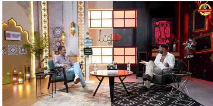
Gambar 3. Podcast Log In pada chanel Deddy Corbuzer

menghadirkan dialog yang asyik dan santai antara Habib Husein Ja'far dan Onad, membahas topik-topik keagamaan dengan pendekatan yang ringan dan tidak tegang. Kolaborasi antara seorang penceramah dan seorang entertainer ini memberikan cita rasa baru dalam diskusi keagamaan di platform digital. 3