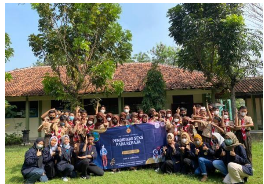
Gambar 1. Pelaksanaan Penyuluhan Pengabdian Masyarakat