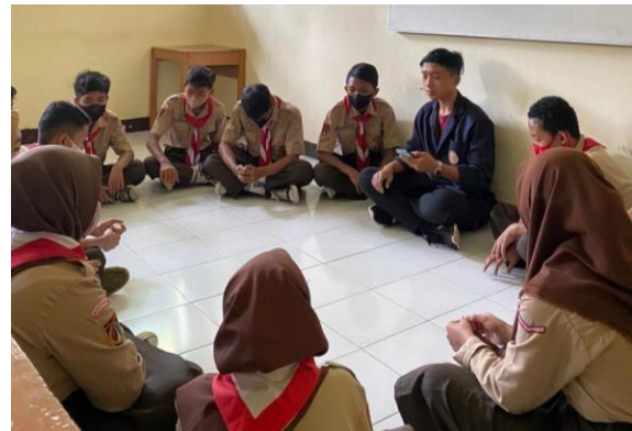
Gambar 2. Penyampaian Materi Penyuluhan

Pengukuran tingkat pengetahuan siswa setelah diberikan penyuluhan kesehatan bahaya