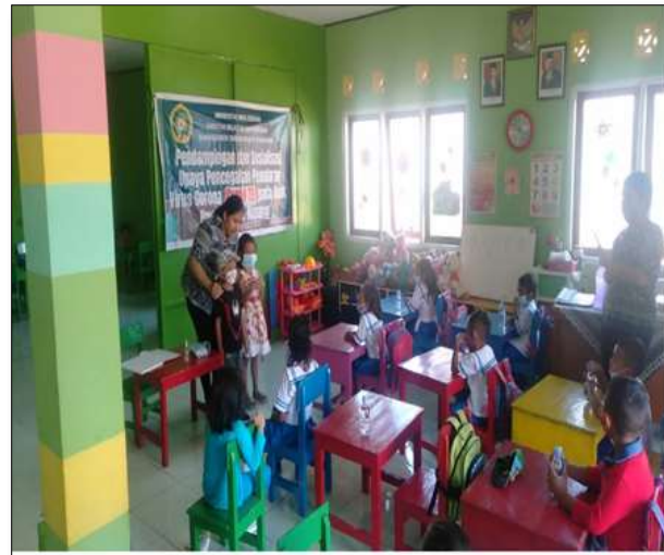
Dokumentasi Kegiatan Pendampingan Dan Sosialisasi Upaya Pencegahan Penularan Virus Corona (Covid 19) Pada Anak Paud Di Kota Kupang