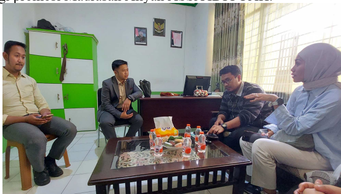
Gambar 3. Diskusi tindak lanjut ke depannya dengan pihak Sekolah

cenderung lebih cocok untuk pengajar muda yang lebih terpapar oleh teknologi. Pada tanggal 27 Desember 2023 sekitar pukul 09.00 – 12.000 WIB, kegiatan pengabdian ini dilanjutkan dengan diskusi dengan wakil kepala sekolah, perwakilan guru, dan ini adalah mendiskusikan mengenai rencana tindak lanjut dan mengidentifikasi strategi promosi Madrasah Aliyah ASSA'IDIYYAH.