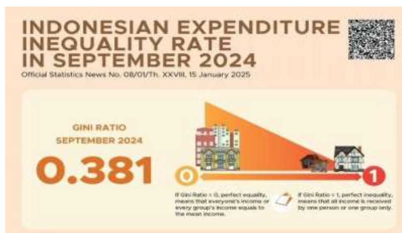
Gambar 1. Indeks Gini Ratio Indonesia

Data dari Badan Amil Zakat Nasional (Baznas, 2024) menunjukkan bahwa potensi zakat nasional di Indonesia mencapai sekitar Rp327,6 triliun per tahun, namun tingkat realisasi penghimpunannya baru sekitar Rp30 triliun atau kurang dari 10% dari total potensi yang ada (Achmad, 2024). Hal ini menggambarkan bahwa masih terdapat kesenjangan besar antara potensi dan realisasi zakat