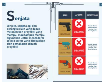
Gambar 6. Halaman penjelasan tentang senjata ( weapons )