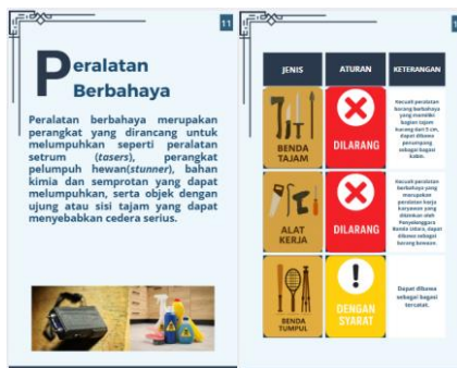
Gambar 7. Halaman penjelasan tentang peralatan berbahaya ( dangerous articles )