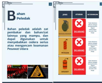
Gambar 5. Halaman penjelasan tentang bahan peledak ( explosives )