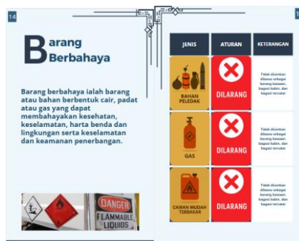
Sumber: Penulis Tahun 2025 Gambar 8. Halaman penjelasan tentang barang berbahaya ( dangerous goods )