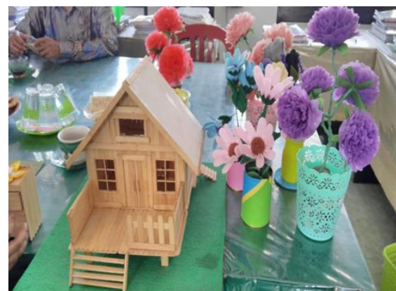
Gambar 5. Miniatur Rumah dan Bunga dari Daur Ulang Plastik

Pondok Pesantren Al Islahuddiny telah mengikuti beberapa event pameran wirausaha, satu diantaranya adalah peringatan hari santri yang jatuh setiap 22 Oktober 2021. Adapun salah satu hasil dari kreativitas santri setelah mengikuti pelatihan santripreneur untuk kemandirian pesantren adalah membuat kerajinan handmade berbahan dasar daur ulang sampah.