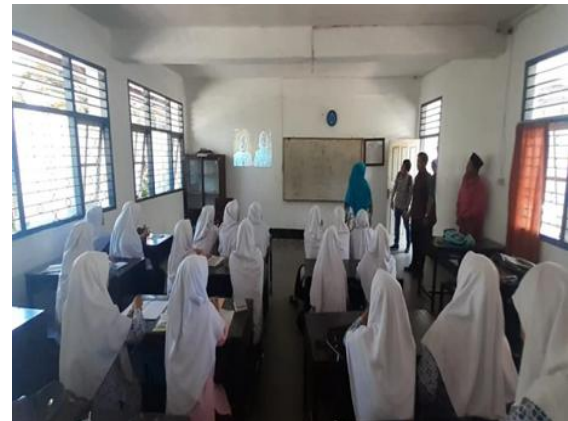
Gambar 4. Kegiatan Sosialisasi Wirausaha di Kelas Madrasah Aliyah (MA) Putri

Pondok Pesantren Al Islahuddiny telah mengikuti beberapa event pameran wirausaha, satu diantaranya adalah peringatan hari santri yang jatuh setiap 22 Oktober 2021. Adapun salah satu hasil dari kreativitas santri setelah mengikuti pelatihan santripreneur untuk kemandirian pesantren adalah membuat kerajinan handmade berbahan dasar daur ulang sampah.