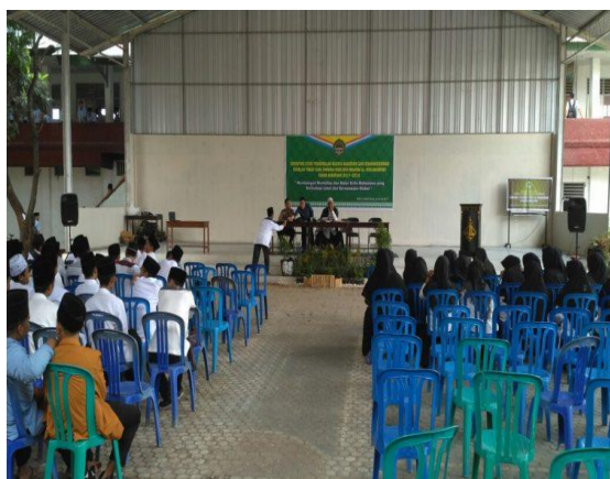
Gambar 3. Aula Ponpes Al Islahuddiny Lokasi Kegiatan Santripreneur

Berikut adalah rincian jumlah santri putra, putri dimasing-masing tingkatan, Madrasah Tsanawiyah (MTs) Putra berjumlah 381 santriwan (21%), MTs Putri berjumlah 350 santriwati (19%), Madrasah Aliyah (MA) Putra berjumlah 381 santriwan (21%), MA Putri berjumlah 331 santriwati (18%) dan Sekolah Tinggi Ilmu Dakwah (STID) berjumlah 385 mahasiswa/i (21%). Kegiatan santripreneur yang dilaksanakan BAKTI beberapa waktu lalu diikuti oleh perwakilan kelas dan tingkatan santri Ponpes Al – Islahuddiny. Pihak pondok pesantren sangat terbuka terhadap kegiatan /program yang dilakukan pemerintah, wujud keterbukaan itu terlihat dari fasilitasi tempat sosialisasi yang disediakan cukup luas untuk bisa menampung perwakilannya yang ikut dalam kegiatan tersebut. Berikut adalah dokumentasi kegiatan pelatihan wirausaha.