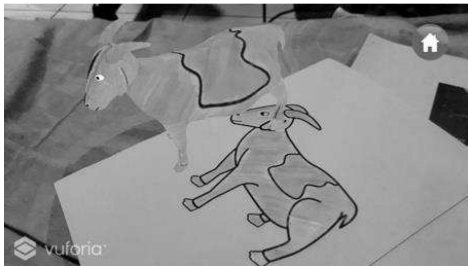
Gambar 4. Uji Coba Kamera AR

Jarak minimal kamera dan kertas adalah 30 cm atau yang memungkinkan kamera untuk menyorot kertas secara penuh. Hasilnya dicatat pada tabel 1 yang sudah disiapkan. Gambar 4 menunjukkan hasil uji coba aplikasi augmented reality yang di scan menggunakan kamera smartphone.