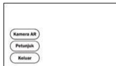
Gambar 3. Interface Menu Utama

Interface dibuat berdasarkan rancangan menggunakan software Corel Draw X4. Perancangan interface meliputi perancangan pada menu utama, kamera, petunjuk, dan keluar. Untuk tombol yang digunakan, penulis menggunakan tombol berupa gambar bitmap. Gambar 3 berikut adalah rancangan user interface yang akan dibangun: