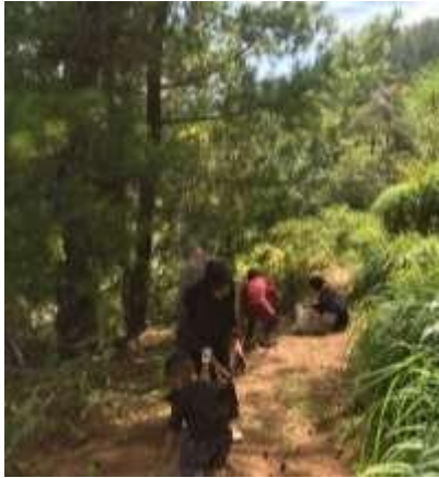
Gambar 2. Pengumpulan Buah pinus

ketersediaan bahan baku yang melimpah dari hutan pinus, efisiensi pembakaran tinggi dan panas yang sangat kuat, kandungan abu yang rendah, aroma yang menyegarkan saat dibakar, dan ramah lingkungan. Kemudian briket dari buah pinus juga memiliki kelemahannya seperti risiko terjadinya pencemaran udara akibat emisi gas beracun saat pembakaran, potensi terbakarnya dengan cepat, dan rasio pembakaran yang kurang stabil dibandingkan dengan jenis yang lain.