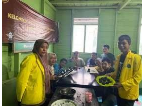
Gambar 3 Pelatihan Pembuatan Produk Briket dari Buah Pinus

Setelah pelatihan berakhir, Tingkat keberhasilan kegiatan sebagian besar peserta memberikan apresiasi terhadap kelompok pelatihan khususnya cara pembuatan briket dari buah pinus dan juga para peserta dapat mengetahui bagaimana proses pembuatan dari tahap awal hingga akhir dalam proses pembuatan produk briket. Sehingga masyarakat dapat melanjutkan produk briket tersebut dan dapat dipromosikan kepada konsumen.