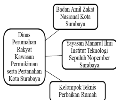
Bagan 1.1 Model Kolaborasi Program Dandan Omah

Kegiatan Pola kolaborasi yang dilakukan oleh Dinas Perumahan Rakyat Kawasan Permukiman serta Pertanahan Kota Surabaya dengan aktor lain dapat dilihat pada bagan berikut ini :