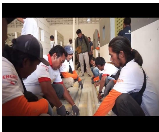
Gambar 3. Pelatihan Baja ringan Satgas DPRKPP

Dalam pelaksanaannya, DPRKPP menggandeng Institut Teknologi Sepuluh Nopember dan pihak lain untuk menyelenggarakan kegiatan pelatihan tersebut. Kegiatan pelatihan tersebut dapat dilihat pada gambar berikut :