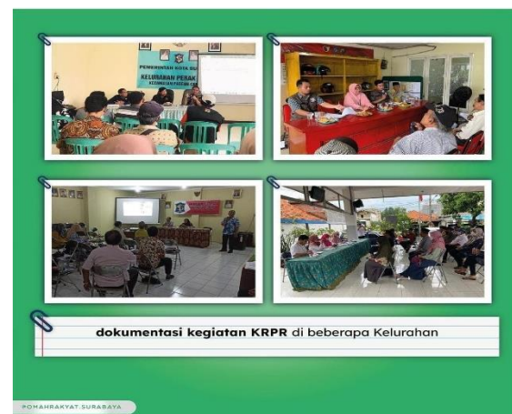
Gambar 2. Dokumentasi Kegiatan KRPR di beberapa Kelurahan

KTPR menjadi penghubung antar pihak yang terlibat terutama pemangku kepentingan di tingkat bawah yang bertujuan untuk mempermudah dan mempercepat pelaksanaan program Dandan Omah. Dengan pemahaman mendalam tentang kondisi dan kebutuhan masyarakat lokal, KTPR mampu memfasilitasi dialog yang efektif dan membangun konsensus. Lebih lanjut, KTPR juga melakukan fungsi pengawasan yang mana dalam hal ini merupakan tugas utama dari KTPR bagian pengawasan. Dokumentasi kegiatan KRPR dapat dilihat pada gambar berikut :