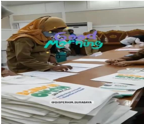
Gambar 5. Pembagian tas berlogo Dandan Omah saat sosialisasi

mempercepat pencairan dana, pihak DPRKPP Kota Surabaya juga membuat souvenir baik itu tas kain, jam dinding dan juga topi yang didesain dengan menempelkan logo program Dandan Omah. Hal tersebut bertujuan sebagai upaya sosialisasi untuk menyebarluaskan bahwa DPRKPP Kota Surabaya memiliki program ini. Dokumentasi pembagian souvenir berlogo program Dandan Omah dapat dilihat pada gambar berikut: