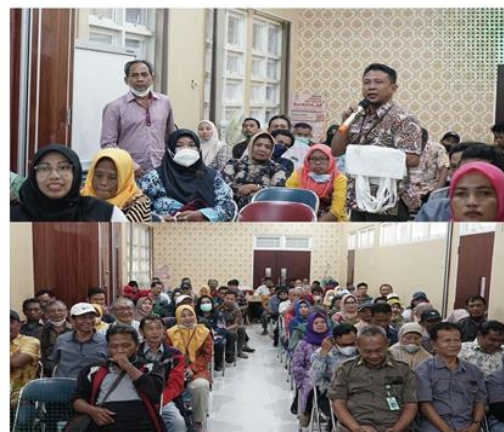
Gambar 1. Forum Koordinasi dan Bimbingan Teknis KTPR

Selain menginisiasi adanya kerjasama dengan pihak diluar pemerintahan dan menjalin komunikasi secara berkelanjutan, DPRKPP juga melakukan pendampingan terhadap Kelompok Teknis Perbaikan Rumah di lapangan. Lebih lanjut, peran Dinas Perumahan Rakyat Kawasan Permukiman serta Pertanahan Kota Surabaya sebagai koordinator dapat dilihat pada gambar berikut ini: