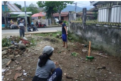
Gambar 2.1. Pekarangan rumah warga yang tidak dimanfaatkan

Kelurahan Amassangan merupakan salah satu kelurahan yang terletak di kecamatan wara kota palopo, Provinsi Sulawesi Selatan, Indonesia. Kelurahan Amassangan penduduknya mayoritas bekerja sebagai petani. Pada saat melakukan observasi di sekitar kelurahan Amassangan diketahui banyak masyarakat yang belum memanfaatkan lahan pekarangan rumahnya dengan maksimal. Rendahnya kesadaran masyarakat terhadap pemanfaatan lahan pekarangan rumah menjadi masalah yang kemudian berdampak pada perekonomian dan gizi masyarakat di Kelurahan Amassangan. Dengan adanya sosialisasi dan kegiatan yang terkait Pembuatan Lahan Percontohan Skala Rumah Tangga diharapkan masyarakat dapat memanfaatkan pekarangan rumah dengan maksimal.