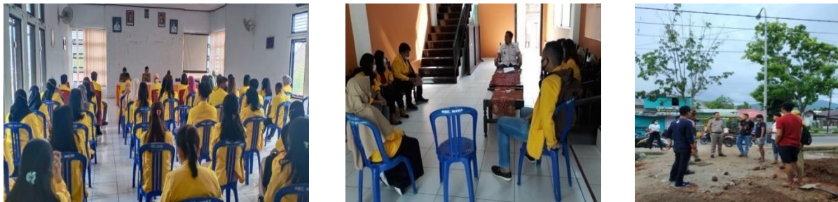
Gambar 4.1. Kegiatan koordinasi dan sosialisasi Pembuatan Lahan Percontohan Skala Rumah Tangga

Dalam pelaksanaan kegiatan ini tahap awal yang dilakukan yaitu melakukan koordinasi, observasi dan mengidentifikasi masalah yang ada pada Kelurahan Amassangan kemudian dilanjutkan dengan sosialisasi yang dilaksanakan di Aula Kantor Kelurahan Amassangan peserta kegiatan sosialisasi dihadiri oleh masyarakat dan perangkat kelurahan dan mahasiswa TIM KKN peserta sangat semangat dan antusias dalam mengikuti pelaksanaan kegiatan pelatihan dimana saat melakukan diskusi banyak peserta yang mengajukan pertanyaan tentang permasalahan lahan dan tanaman serta pengendalian hama dan penyakit pada tanaman.