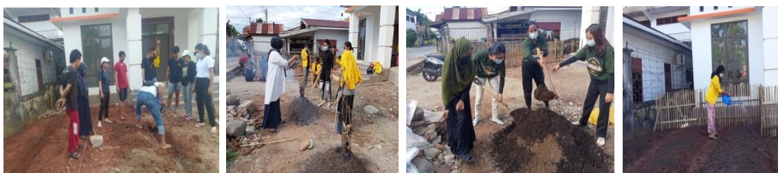
Gambar 4.2. Pelaksanaan kegiatan, persiapan lahan, pembakaran sekam dan pencampuran sekam bakar dengan pupuk kompos

Kegiatan sosialisasi dimaksudkan untuk menambah wawasan dan pengetahuan kepada masyarakat dan petani dan merupakan salah satu cara mengajak masyarakat dalam memanfaatkan lahan perkarangan rumah untuk mendukung ketahanan pangan pada masa sekarang ini dengan membudidayakan tanaman hortikultura yang aman, mudah dan ramah lingkungan.