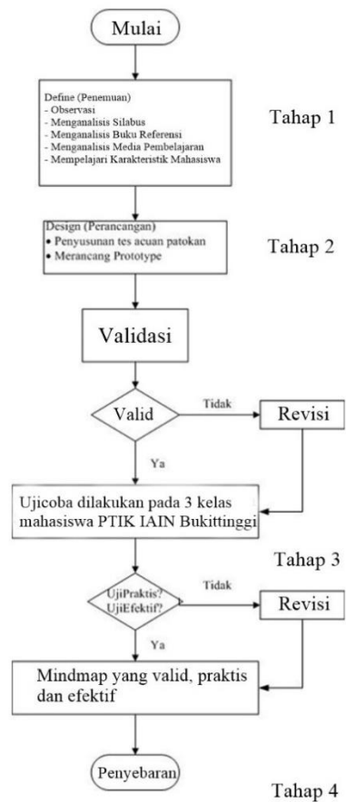
Gambar 3. Tahapan Penelitian

Tahap penyebarluasan ( disseminate ), Proses diseminasi merupakan suatu tahap akhir pengembangan. Tahap diseminasi dilakukan untuk mempromosikan produk pengembangan agar bisa diterima oleh pengguna, baik individu, suatu kelompok, atau sistem. Peyebaran ini dilakukan ditempat penelitian (IAIN Bukittinggi) dan pada pelatihan-pelatihan ICT MGMP yang mana penulis sendiri sebagai narasumbernya.