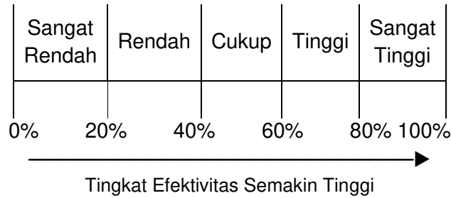
Gambar 2. Garis kontinum tingkat efektifitas

Analisis regresi linier berganda digunakan untuk menganalisis berbagai faktor yang memengaruhi efektivitas metode penyuluhan demonstrasi cara dalam pengendalian hama tikus pada padi sawah di Kecamatan Air Putih, Kabupaten Batu Bara dengan Persamaan 3.