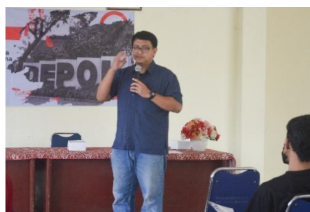
Gambar 2. Penyuluhan Dilakukan dengan Cara Ceramah

Dokumentasi bertujuan sebagai sumber data sekunder yang digunakan untuk memperoleh data berupa foto-foto proses kegiatan pelatihan yang dilaksanakan dari awal hingga berakhirnya kegiatan.