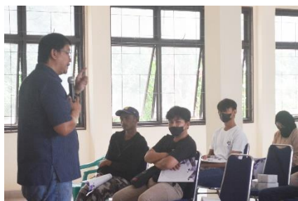
Gambar 4. Pemberian Materi Saat Sosialisasi

Partisipasi masyarakat dalam melawan kekerasan seksual dapat diwujudkan berupa pencegahan, pendampingan, pemulihan, dan pemantauan terhadap tindak pidana kekerasan seksual. Masyarakat dari berbagai lapisan usia perlu memahami mengenai literasi tentang tindak pidana kekerasan seksual, seperti sosialisasi undang-undang yang mengatur tindak pidana kekerasan seksual. Hal tersebut tentunya berguna untuk mencegah terjadinya kekerasan seksual dengan tidak menjadi korban ataupun pelaku.