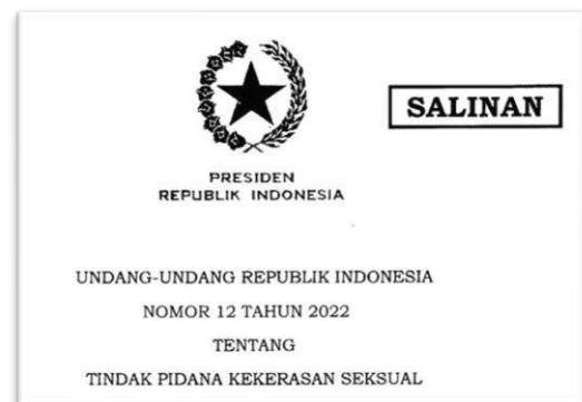
Gambar 1. Undang-Undang Tindak Pidana Kekerasan Seksual

Tindak Pidana Kekerasan Seksual untuk disahkan menjadi Undang-Undang dalam Rapat Paripurna DPR ke-19 Masa Persidangan IV Tahun Sidang 2021-2022 pada Selasa, 12 April 2022. Rancangan Undang-Undang tersebut disahkan menjadi Undang-Undang Nomor 12 Tahun 2022 tentang Tindak Pidana Kekerasan Seksual dalam Lembaran Negara Tahun 2022 Nomor 120. Ketua DPR Puan Maharani meminta agar Undang-Undang Nomor 12 Tahun 2022 tentang Tindak Pidana Kekerasan Seksual segera dibuat aturan turunannya dan masif disosialisasikan kepada masyarakat agar Indonesia terbebas dari kekerasan seksual (dpr.go.id, 2022).