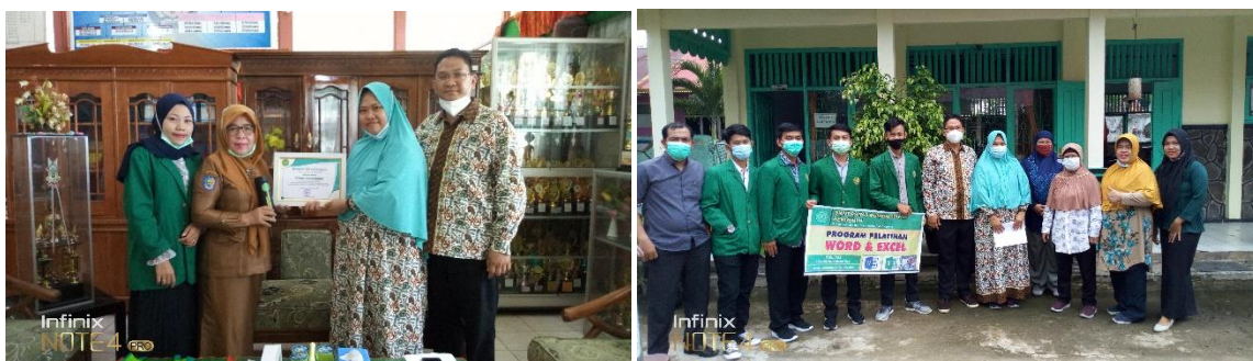
Gambar 1. Kegiatan Pengabdian SD N 04 Kota Bengkulu