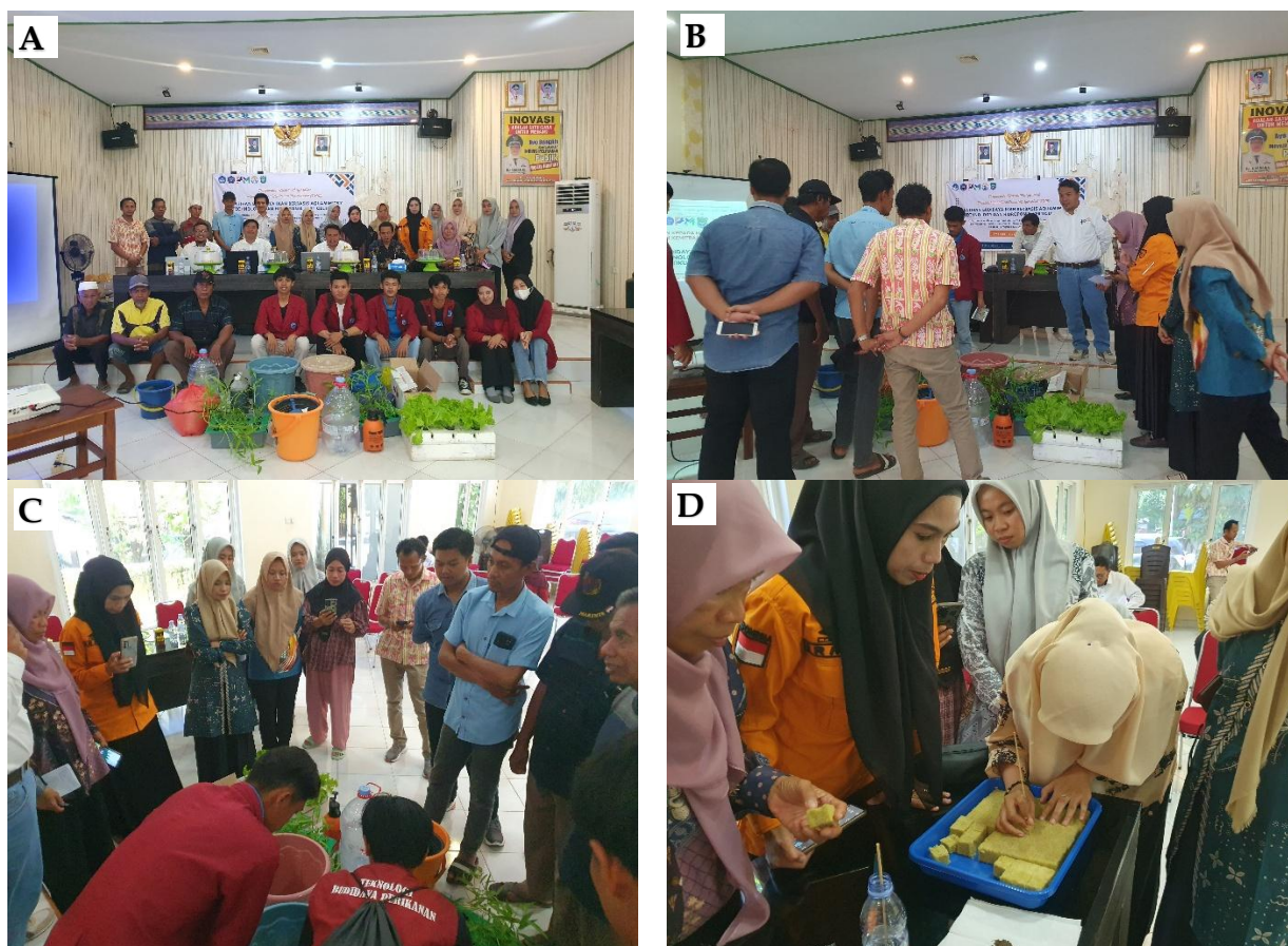
Gambar 3. Kegiatan demonstrasi pembuatan fermentasi dedak dan penyemaian benih hidroponik; (A) Peserta pelatihan; (B) Pengambilan sampel saluran; (C) Demonstrasi fermentasi dedak; (D) Demonstrasi penyemaian benih hidroponik.

metode aquaponik yang dimana mendapatkan sumber nutrisi dari budidaya ikan berupa nutrisi alami hasil dari proses ekskresi dari ikan yang dipelihara (Yulianyaha, 2022). Pengenalan komponen-komponen dalam sistem budidaya ikan nila berbasis aquamimicry dan hidroponik vertikulture sangat penting untuk memahami hubungan dan peran masing-masing komponen dalam menjaga sistem berjalan dengan baik. Sistem budidaya ikan dan tanaman (aquaponik) yang seimbang dan terawat dengan baik akan memberikan hasil panen yang baik dan mendukung pertanian berkelanjutan (Ristiyana et al. , 2023).