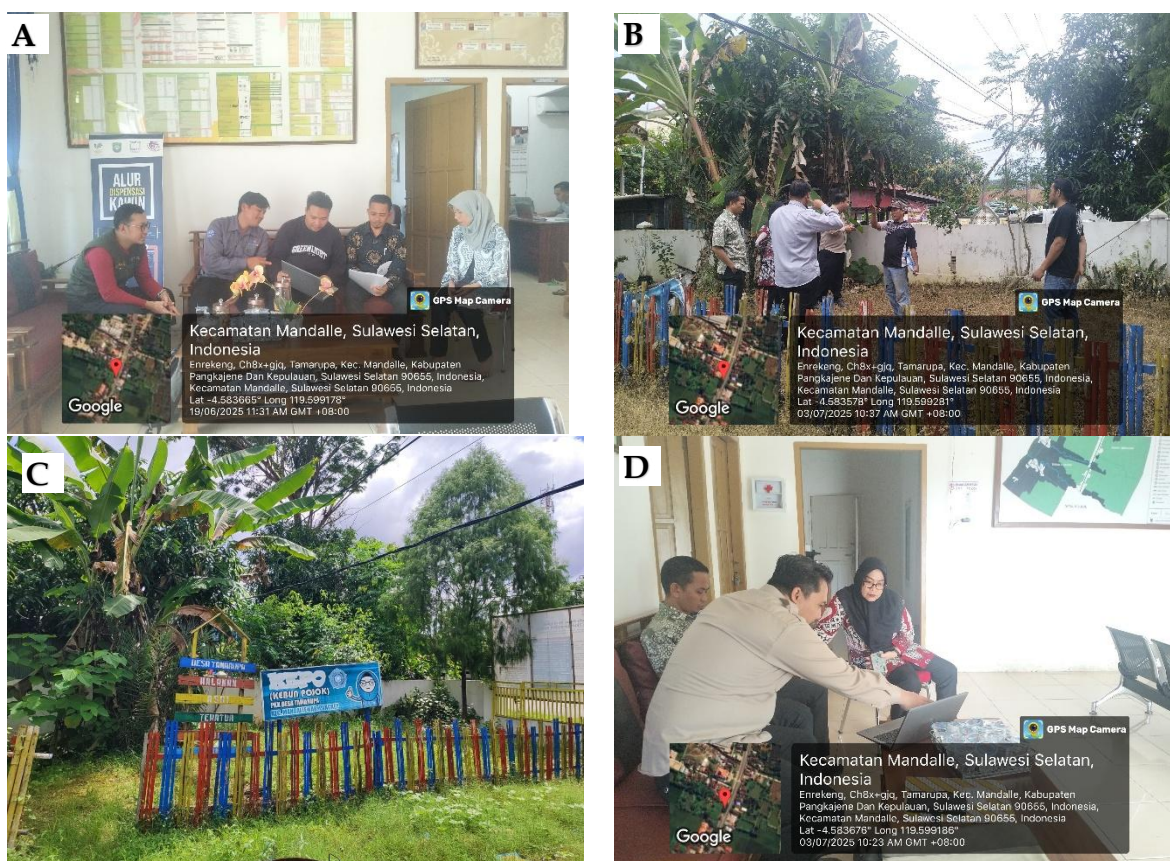
Gambar 1. Kegiatan observasi pemanfaatan pekarangan di Desa Tamarupa; (A) Sosialisasi tujuan kegiatan PKM dengan perangkat Desa Tamarupa; (B) Survei lapangan lahan pekarangan; (C) Kondisi lahan pekarangan mitra; (D) Sosialisasi hasil temuan pemanfaatan lahan pekarangan.