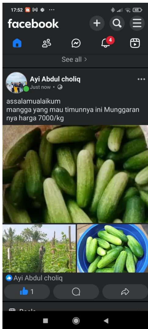
Gambar 3. Pemasaran Digital