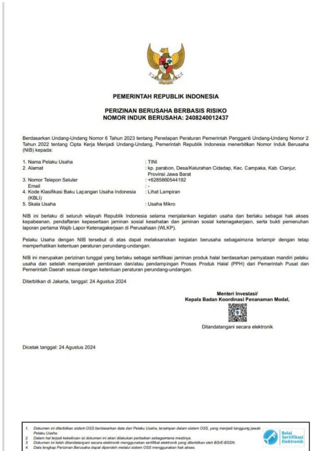
Gambar 5 NIB