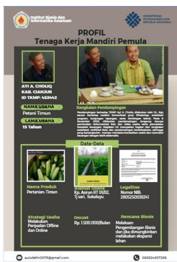
Gambar 1 Profil TKMP

Dengan adanya pencatatan keuangan yang lebih tertib dan terstruktur, peserta dapat mengetahui kondisi keuangan usahanya secara lebih akurat, seperti tingkat keuntungan dan efisiensi penggunaan modal. Hal ini memungkinkan peserta untuk membuat keputusan usaha yang lebih rasional, misalnya dalam menentukan harga jual, mengendalikan biaya, serta merencanakan pengembangan usaha di masa mendatang. Hasil ini memperkuat temuan berbagai penelitian sebelumnya yang menekankan pentingnya manajemen keuangan sederhana bagi keberlanjutan UMKM.