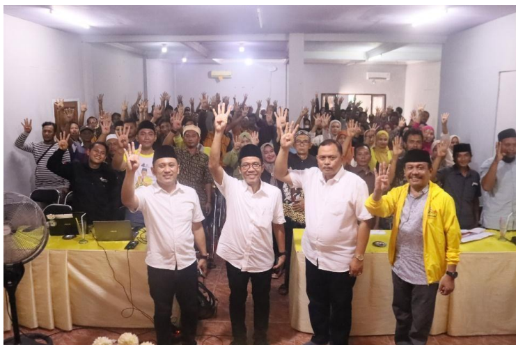
Gambar 2. Proses Konsolidasi dengan Pilar Genggong

pesantren. Alumni pesantren tersebar di seluruh negara menjadi pendorong untuk mendorong dukungan yang lebih besar. Masyarakat pemilih sulit mengabaikan rasa kedekatan yang dibangun oleh hubungan emosional Misbakhun dengan komunitas pesantren.