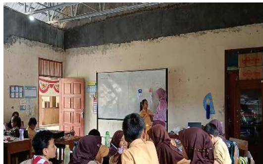
Gambar 2. Pembelajaran menggunakan media ubur-ubur

ubur terdapat contoh kalimat transitif dan intransitif. Fokus diberikan pada penerapan permainan berupa kuis. Dengan mengacu pada hasil temuan yang telah dijelaskan, kesimpulannya adalah bahwa penggunaan pembelajaran berbasis game efektif. Terbukti ada peningkatan nilai setelah dilakukan posttest menunjukkan bahwa penggunaan media ini memiliki dampak positif pada pembelajaran. Berikut gambar suasana kelas dalam pelaksanaan pembelajaran berbasis game ubur-ubur.